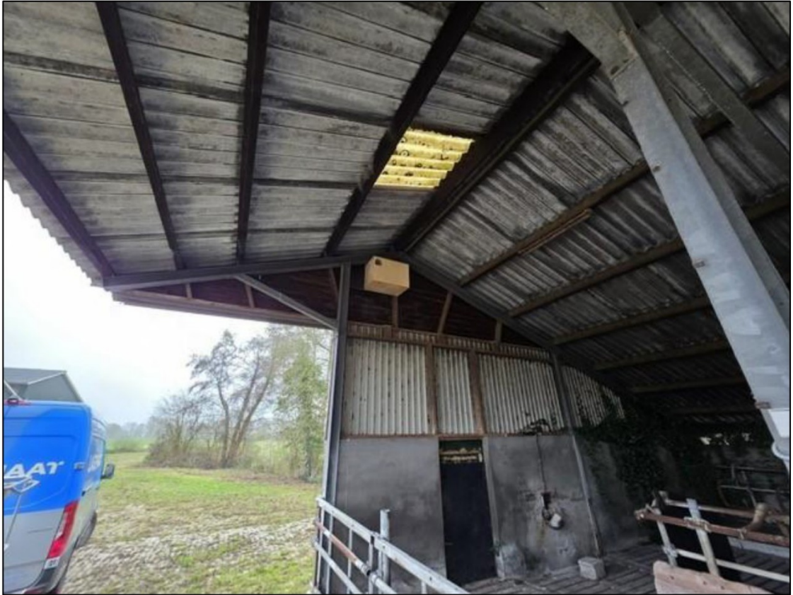
Figuur 3: Plaatsing van de kerkuilenkast in de halfopen schuur (nr. 1 in figuur 2).