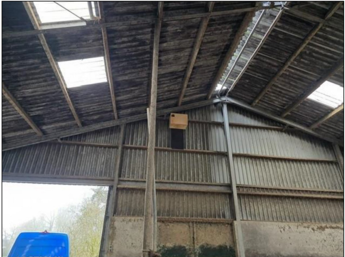
Figuur 4: Plaatsing van de kerkuilenkast in de oude koeienstal (nr. 2 in figuur 2).