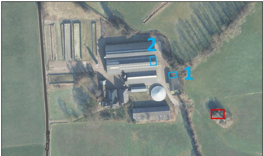
Figuur 2: De locaties van de twee kerkuilenkasten (blauwe vierkanten) t.o.v. het te slopen gebouw (rode vierkant).