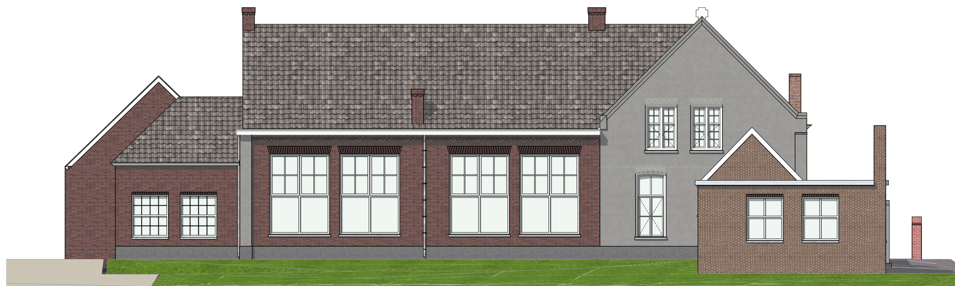
ACHTERGEVEL BESTAAND 1:100

projekt KLOOSTER MAARHEEZE Hoge Weg 1-3 6026 RW Maarheeze