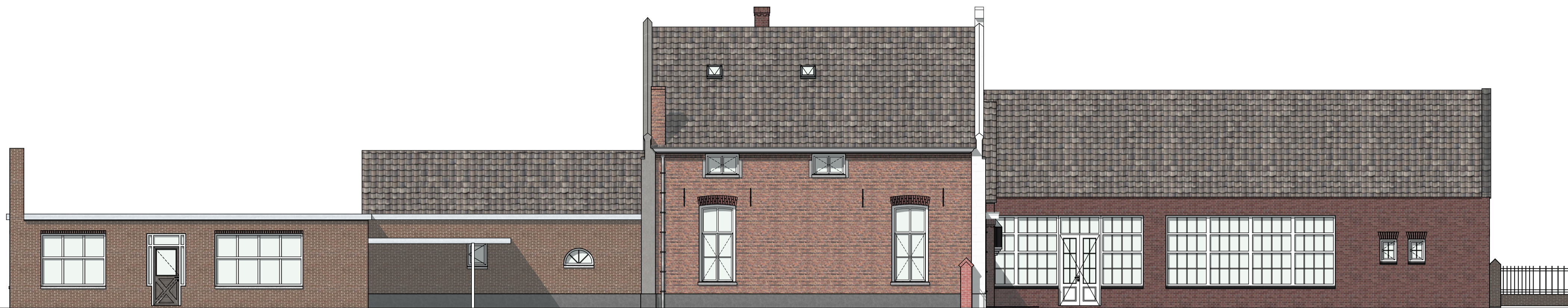
LINKER ZIJGEVEL BESTAAND 1:100