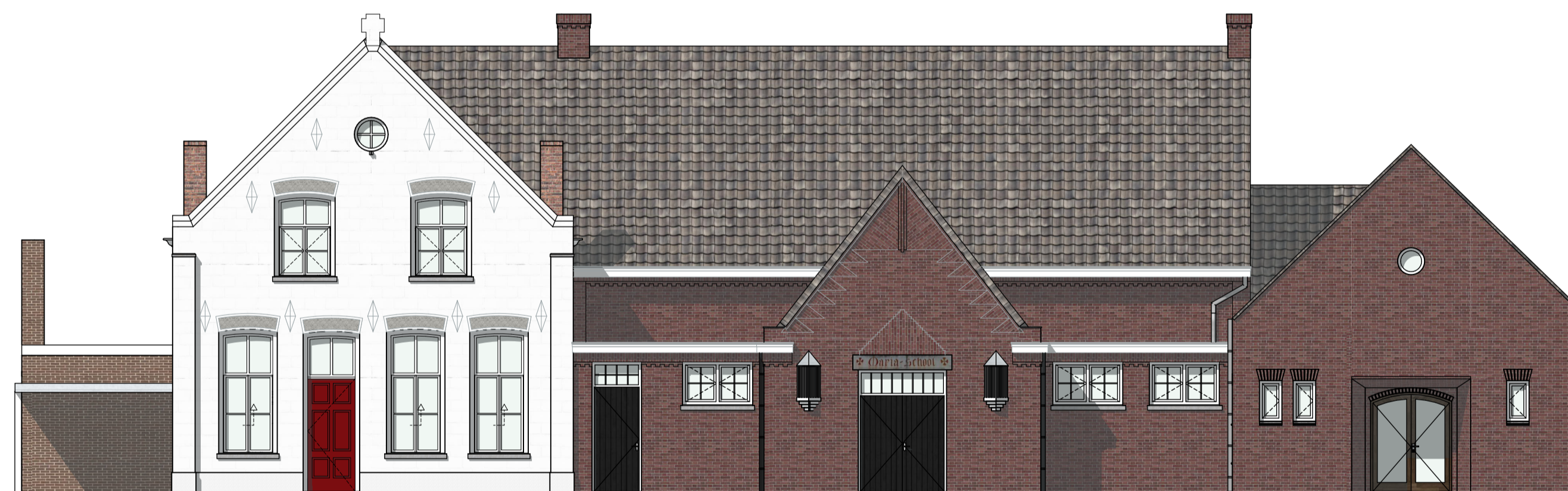
VOORGEVEL BESTAAND 1:100