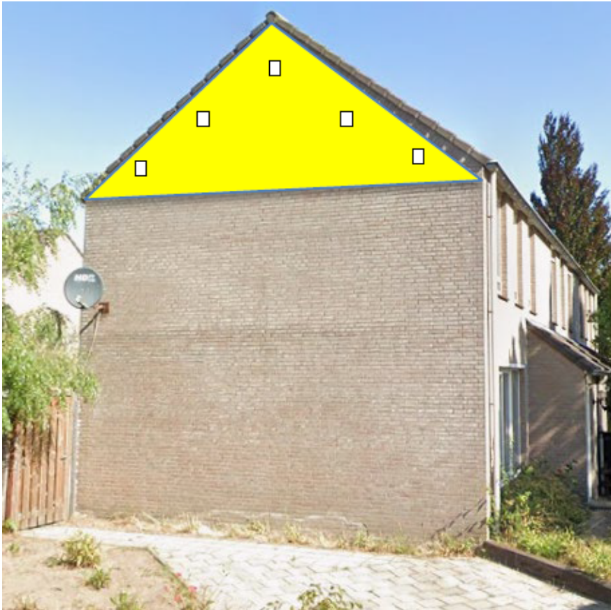
Figuur 3. De spouw van de zolderverdieping wordt niet geïsoleerd.