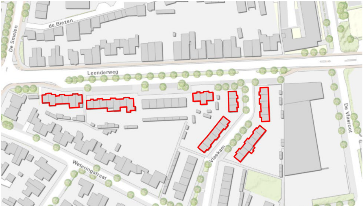
Figuur 1. Overzichtskarta van de werkzaamheden