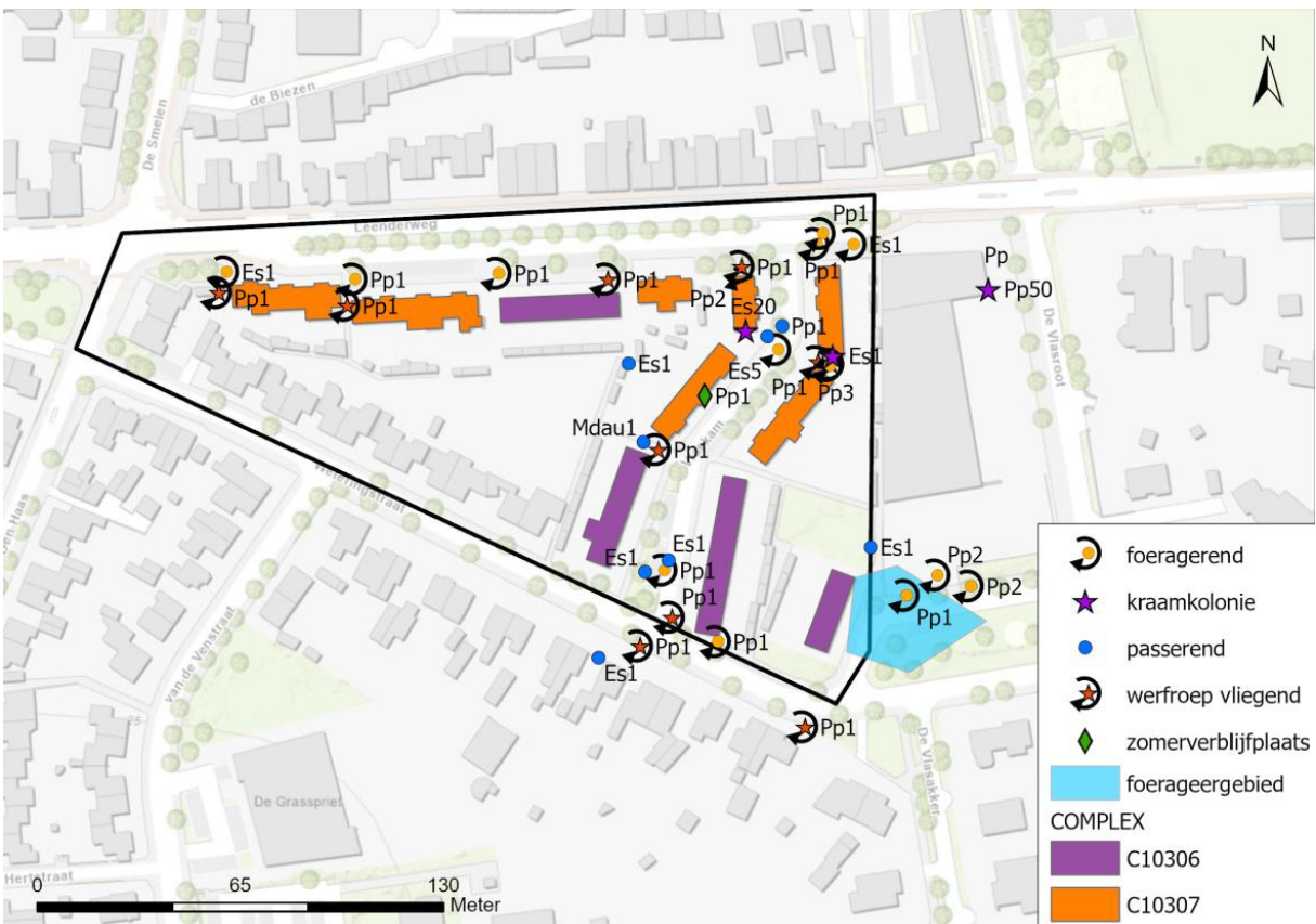
Figuur 2. Overzichtskarta vlermuisverblijfplaatsen binnen Complex 10306 en 10307.