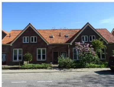
Figuur 2.4 Woningen aan de Rijksstraatweg.