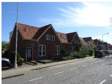
Figuur 2.3 Woningen aan de Rijksstraatweg.