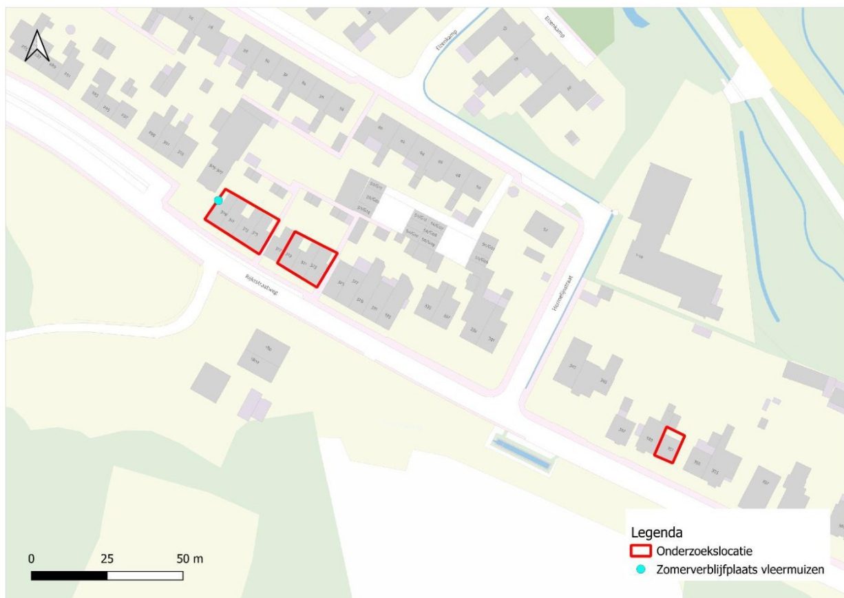
Figuur 4.2 Overzicht van de aangetroffen verblijfplaats van de gewone dwergvleermuis (blauwe stip) op en in de omgeving van de onderzoekslocatie (rood omlijnd).

Vleermuizen maken veelal gebruik van lijnvormige (donkere) landschapselementen als houtsingels, beken en lanen om zich te verplaatsen tussen verblijfplaatsen en foerageergebieden. Deze elementen zijn niet binnen de onderzoekslocatie aanwezig. Er zal dan ook geen sprake zijn van het verloren gaan van een essentiële vliegroute.