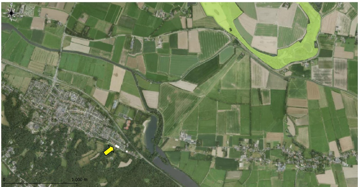
Figuur 6.1 Ligging van de onderzoekslocatie (wit omlijnd) ten opzichte van Natura 2000 (lichtgroene vlak).

De onderzoekslocatie is niet gelegen binnen de grenzen, maar wel in de nabijheid van een gebied dat aangewezen is als Natura 2000. Het meest nabijgelegen Natura 2000-gebied, 'Rijntakken', bevindt zich op circa 2,2 kilometer afstand ten noordoosten van de onderzoekslocatie (zie figuur 6.1).