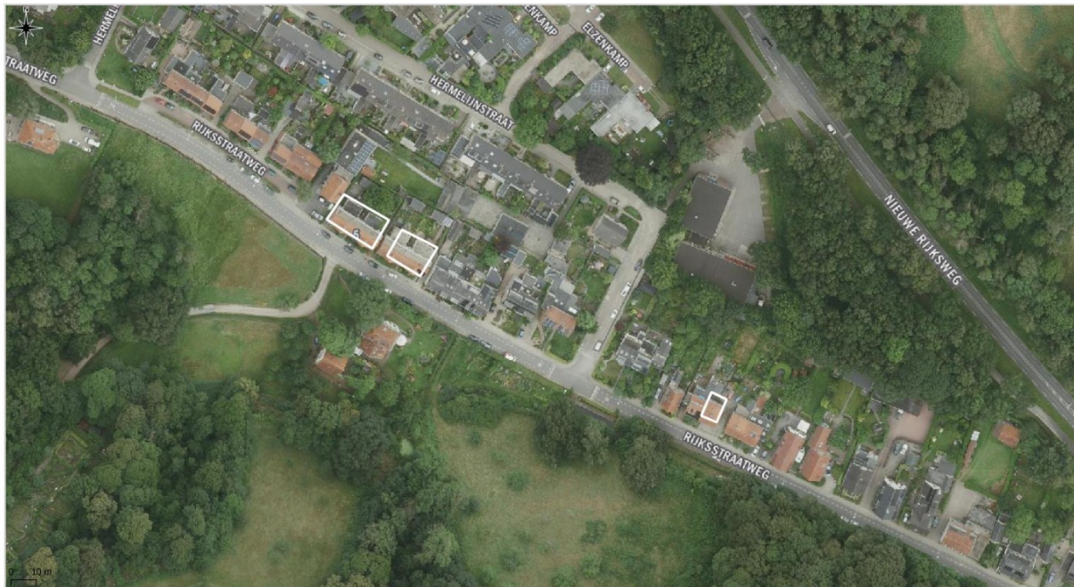
Figuur 2.2 Luchtfoto van de onderzoekslocatie (wit omlijnd).