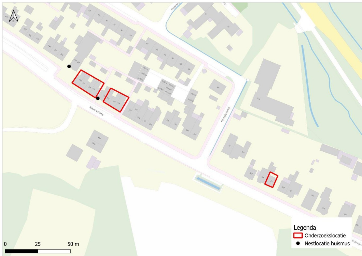
Figuur 4.1 Overzicht van de aangetroffen verblijfplaatsen van huismussen (zwarte stippen) op en in de omgeving van de onderzoekslocatie (rood omlijnd).