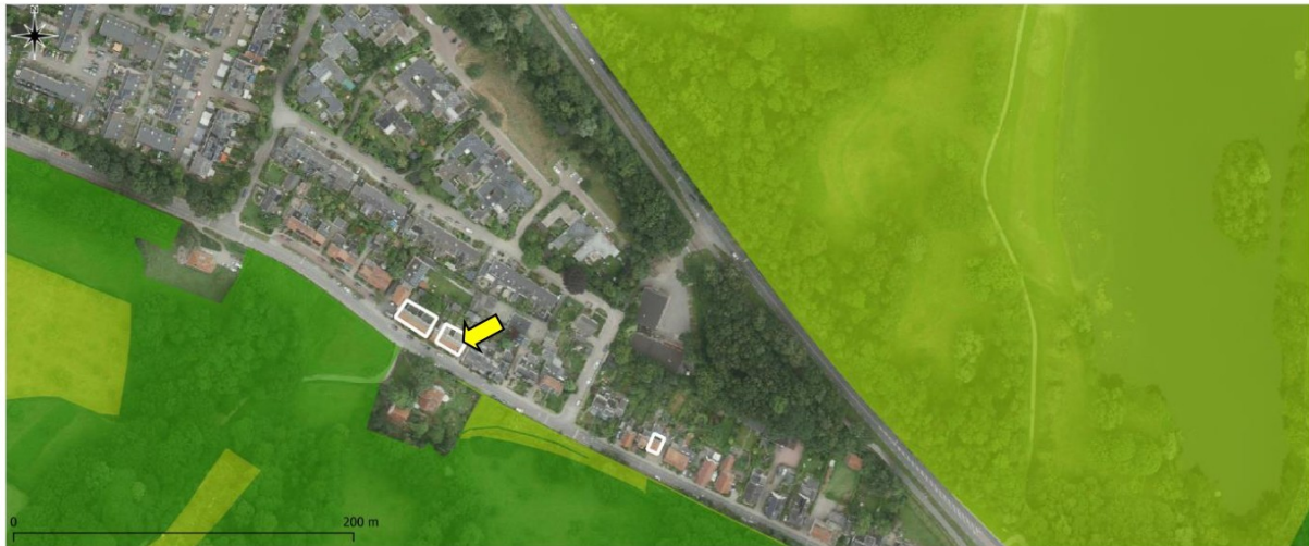
Figuur 6.2 Ligging van de onderzoekslocatie (wit omlijnd) ten opzichte van het Natuurnetwerk Nederland (groene vlakken).

De onderzoekslocatie maakt geen deel uit van het Natuurnetwerk. De onderzoekslocatie ligt echter wel in de nabijheid van een gebied, behorend tot het Natuurnetwerk Nederland. Het meest nabijgelegen gebied bevindt zich circa 12 meter afstand ten westen van de onderzoekslocatie. In figuur 6.2 is de ligging van de onderzoekslocatie ten opzichte van het Natuurnetwerk Nederland weergegeven.