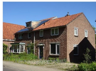
Figuur 2.5 Woningen aan de Rijksstraatweg.