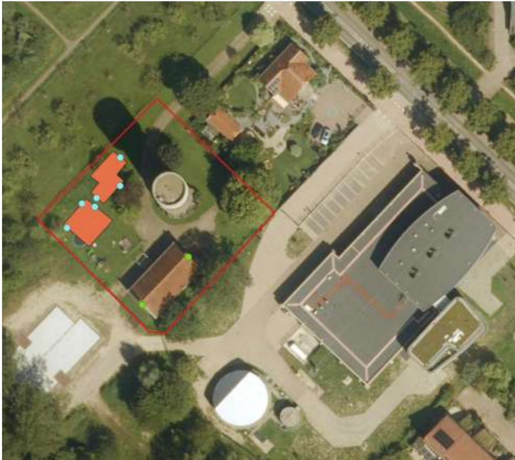
Figuur 4 Overzicht van de permanente verblijfplaatsen, 6 permanente verblijfplaatsen worden gerealiseerd in de nieuwbouwwoningen (aangeduid met de blauwe stippen) en 2 permanente verblijfplaatsen worden gerealiseerd binnen de renovatie van het pomphuisje (aangeduid met de groene stippen).