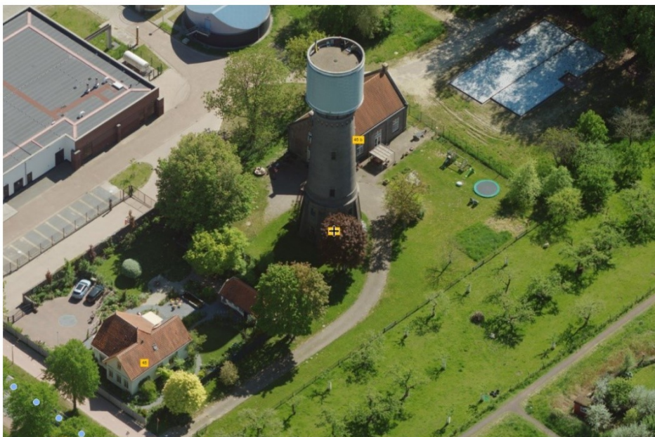
Figuur 2 Weergave vanuit StreetSmart van het plangebied waar de werkzaamheden plaats gaan vinden, duidelijk zichtbaar is de watertoren met daarachter het pomphuis.