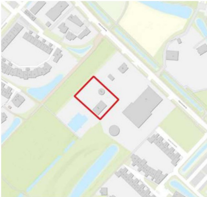
Figuur 1 Overzicht van het plangebied waar de voorgenomen werkzaamheden plaats gaan vinden, Rijksweg 45 te Culemborg.