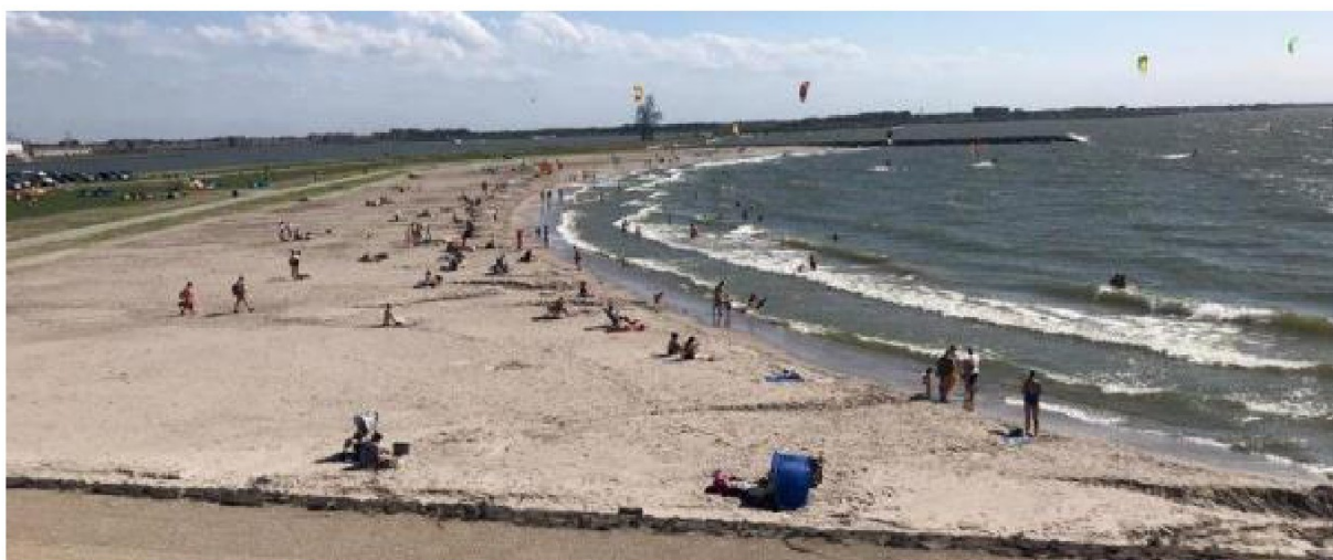
Figuur 2: 'Bataviastrand' in Lelystad waar verschillende doelgroepen samenkomen.

Het Bataviastrand is een mogelijke zwemplek die zich bevindt aan de kust van Lelystad in het Markermeer. Dit strand is in gebruik genomen als watersportstrand, en dit is tot en met 2022 ook zo aan de burgers gecommuniceerd. Met het prachtige weer van de afgelopen seizoenen maken ook zwemmers gebruik van dit strand. In de zomer komen er gevaarlijke situaties voor wanneer zwemmers en kitters op het strand kruisen. Ervaringen vanuit de afgelopen jaren, samen met ervaringen vanuit andere regio's van het land, wijzen erop dat het in de praktijk niet haalbaar zal zijn om zwemmers op deze locatie te weren. Het is namelijk een schitterend strand dat voldoet aan een aanzienlijke vraag.