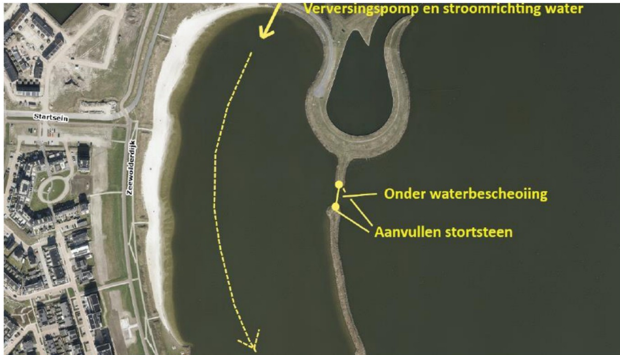
Figuur 1: Luchtfoto van 'het Landerstrand', met aanduidingen voor de verversingspomp, de onderwaterbeschoeiing en het aanvullen met stortstenen.

De gemeente Zeewolde overweegt momenteel een methode voor de toekomstige informatievoorziening, infrastructuur, toiletten en douchevoorzieningen. Tijdens het zwemseizoen 2026 zal het strand opnieuw worden onderzocht en later in het seizoen zal er een gesprek plaatsvinden met de Omgevingsdienst Flevoland & Gooi en Vechtstreek over de mogelijkheden om het Lanterstrand als officiële locatie aan te duiden.