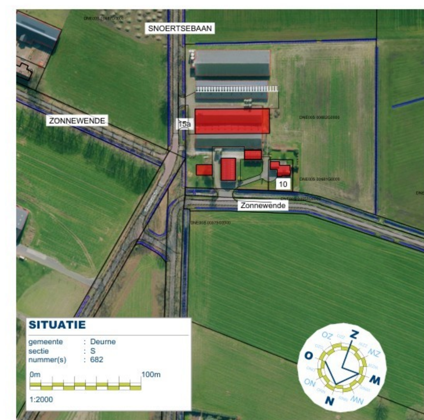
TEKENING BEHORENDE BIJ NATURA 2000