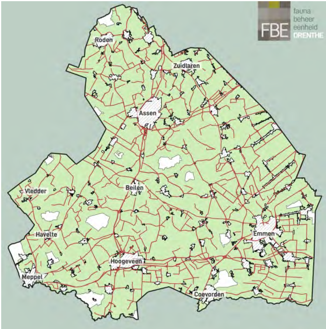
Figuur 1 Uitvoeringsgebied risicovolle wegtrajecten ree Drenthe. De rode lijnen geven de risicovolle wegtrajecten weer. Daar omheen is een groene zone ingetekend van ca 1,5 km die het uitvoeringsgebied vormt van deze vergunning. Bij de totstandkoming van deze kaart is rekening gehouden met de bebouwde kom, en natuurgebieden, waarbij een natuurlijke begrenzing in het veld leidend is geweest (Faunabeheerplan blz. 49)