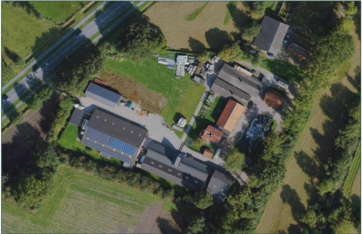
Figuur. Luchtfoto perceel Allermolensteeg 4 te Putten.

Een luchtfoto en topografische kaart met daarop de ligging van de locatie is in navolgende figuren weergegeven.