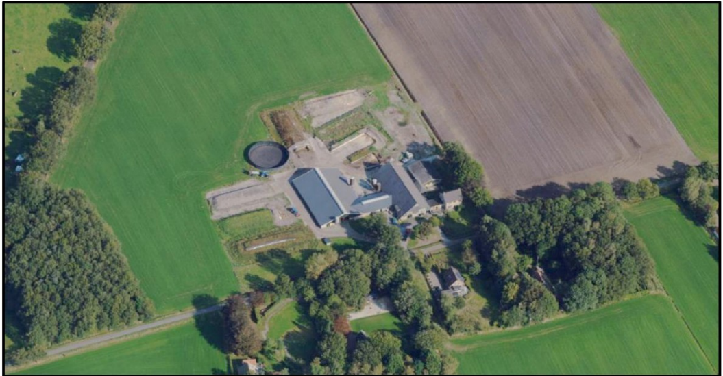
Afbeelding 1: luchtfoto projectlocatie Reeweg 1 te Boijl

De veehouderij is gelegen aan Reeweg 1 te Boijl. Het perceel is kadastraal bekend als gemeente Noordwolde, sectie P, nummers 503, 659 en 660. De activiteitlocatie is gelegen in het buitengebied van de gemeente Weststellingwerf.