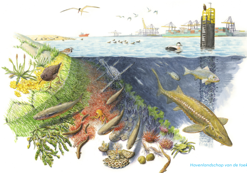
Havenlandschap van de toekomst onder water

Ook in en onder het water barst het van leven. Door de open verbinding tussen achterland en zee, zijn de havens niet alleen een ideale migratieroute voor trekvissen. Maar vormen ze ook een perfect paai- en opgroeigebied voor duizenden vissen. Zeehonden en schepen gebruiken volop hetzelfde water, zonder elkaar in de weg te zitten. De kademuuren en meerpalen zitten vol wieren, algen, zeeanemonen en oesters die op hun beurt weer voedsel zijn voor krabben, vissen en vogels. Waar mogelijk is het natuurlijke intergetijdengebied hersteld.