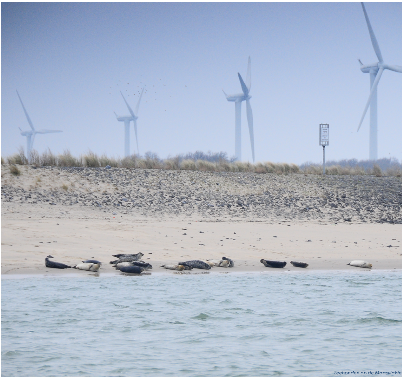
Zeehonden op de Maasvlakte