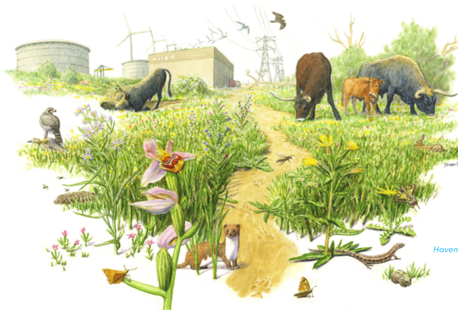
Havenlandschap van de toekomst boven water

Een toekomstbeeld... De bedrijventerreinen gaan op in het duinlandschap en er is volop ruimte voor soorten als parnassia, kleine parelmoervlinder, zandhagedis en (kust)vogels. In het oosten van de haven vind je stedelijke ecosystemen, met soorten die goed gedijen in voedselrijke omgevingen met veel bebouwing, zoals vleermuizen, huismussen, smalle raai, blaasvaren.