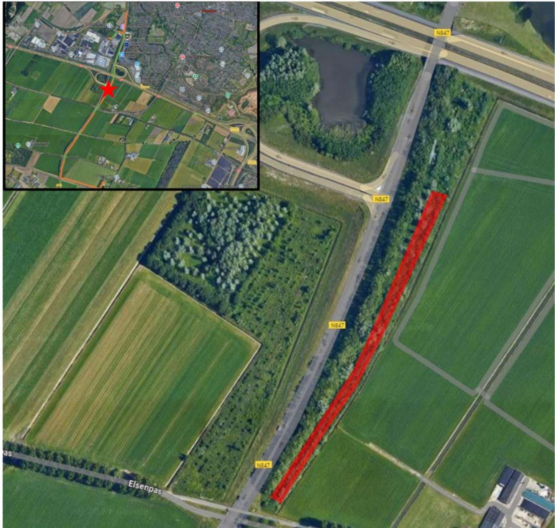
Figuur 1: Het plangebied ligt langs de Schoenaker/N847 en ten zuiden van de A73 in Beuningen.