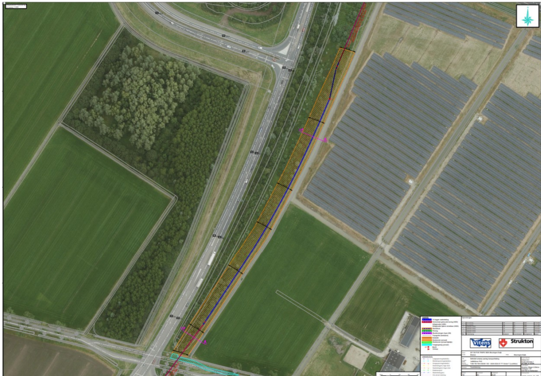
Figuur 2: exacte weergave van het plangebied.