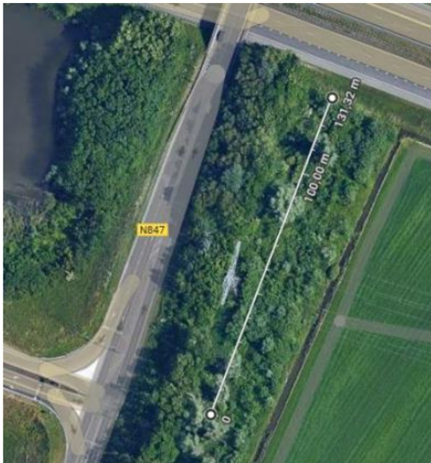
Figuur 4: In de op de luchtfoto aangegeven groenstrook tussen het plangebied en de A73 worden voor 31 augustus 2025 vijf marterhopen gerealiseerd conform Kennisdocument Kleine marterachtigen van Bij12. In de marterhopen worden marterkasten aangebracht.