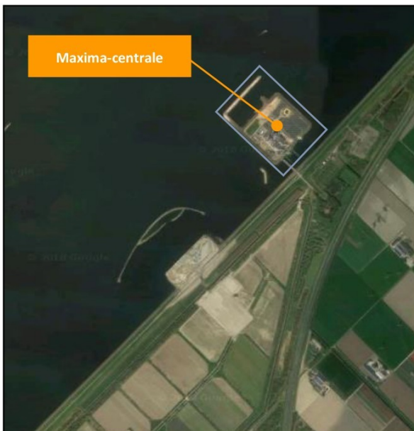
Figuur 2: Ligging Maxima-centrale.