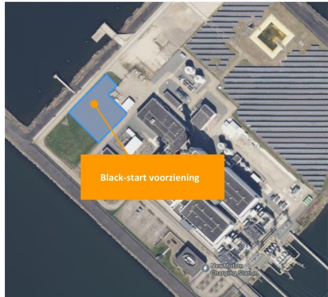
Figuur 3: Globale aanduiding nieuwe activiteit.

De nieuwe activiteit (black-start voorziening) bevindt zich op een terreindeel dat momenteel bestaat uit gemaaid gras.