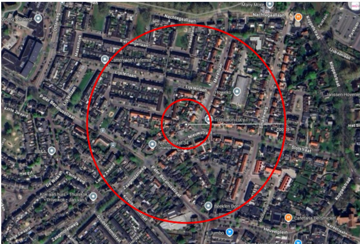
Figuur 2. De globale 50 en 200 meter bufferzone vanaf de te renoveren woningen waarin 4 huismus nestvoorzieningen vóór 1 oktober 2026 geclusterd worden geplaatst ter mitigatie.