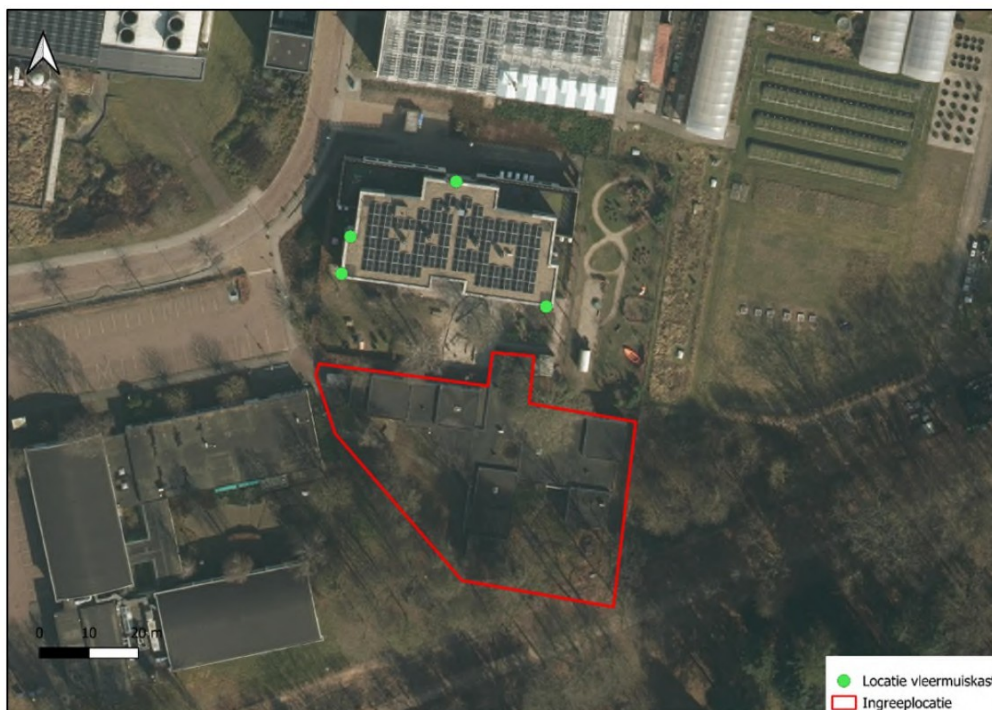
Figuur 3. Locaties van de vier aan te brengen vleermuiskasten ter tijdelijke- en permanente mitigatie