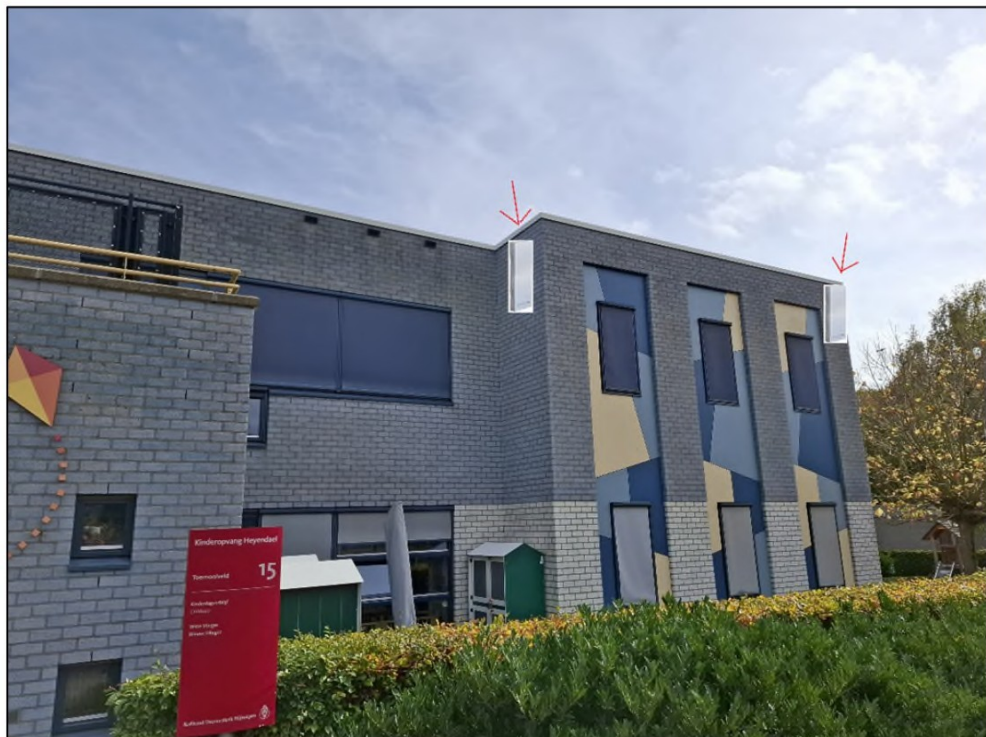
Foto 4. Locaties van de aan te brengen vleermuiskasten aan de zuidwestzijde van Kinderopvang Heyendael.