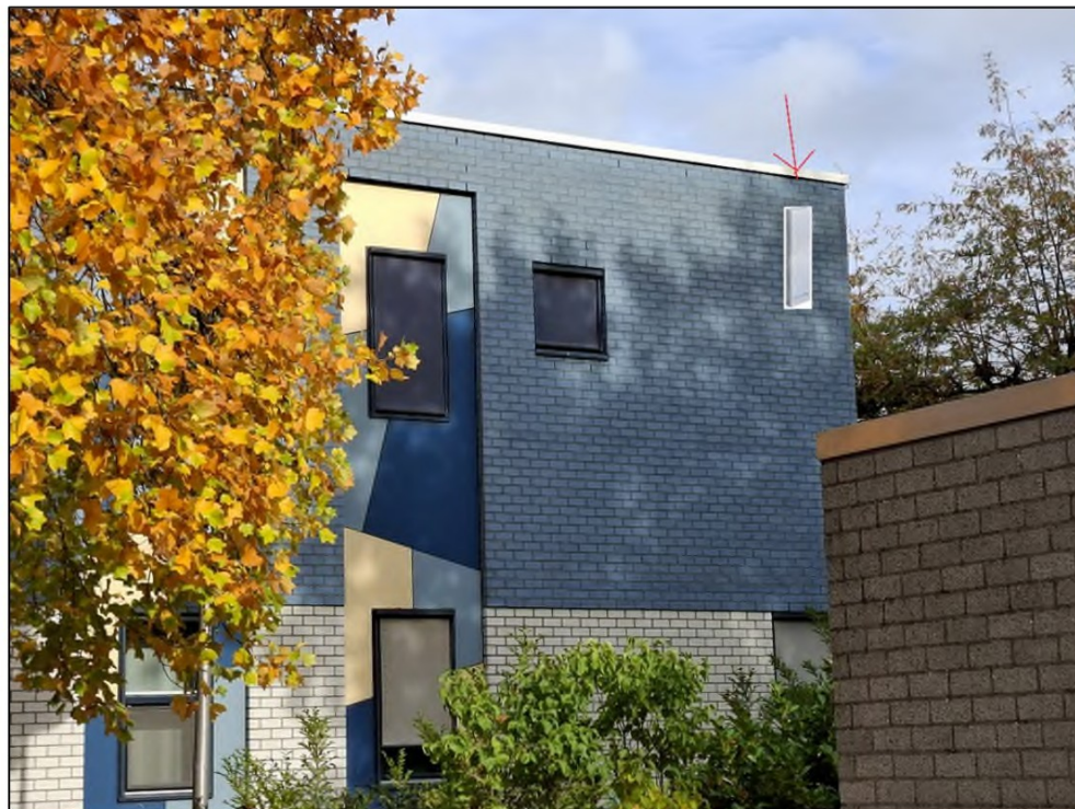
Foto 5. Locatie van de aan te brengen vleermuiskast aan de zuidoostzijde van Kinderopvang Heyendaal.