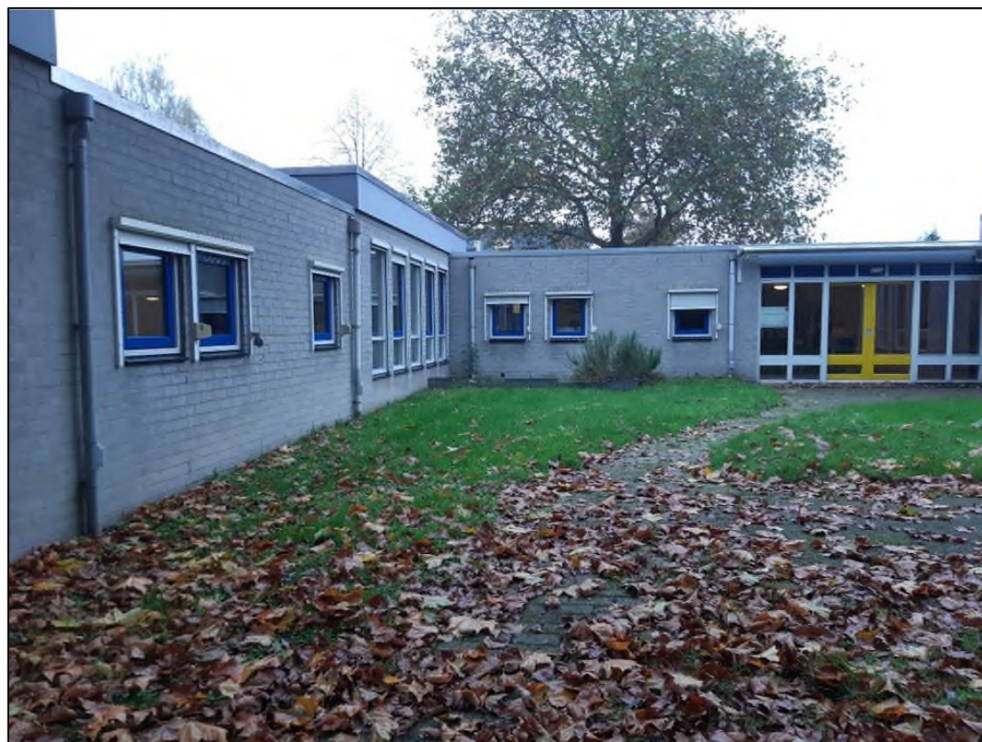
Foto 2. Speelplaats en zuidoostgevel van de Gele Vlieger. Gefotografeerd richting het noorden.