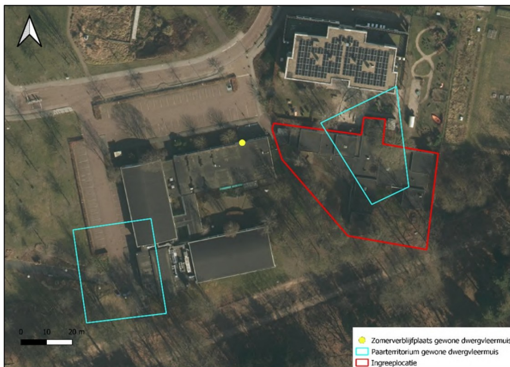
Figuur 2. Locatie van de aangetroffen zomerverblijfplaats en paarterritoria van gewone dwergvleermuis.

In het veldseizoen van 2025 heeft vleermuisonderzoek plaatsgevonden bij het 'Universitair Bedrijvencentrum' (UBC) en het daarnaast gelegen gebouw de 'Gele vlieger'. De eerste veldronde heeft plaatsgevonden op 30 april en betrof een ochtendronde. Bij deze veldronde is een invliegende gewone dwergvleermuis waargenomen in een gat in de rechterbovenhoek van de ingang van het UBC. Tijdens de veldrondes op 21 mei en 18 juni zijn geen uitvliegende vleermuizen waargenomen, enkel foeragerende gewone dwergvleermuizen. Tijdens de paarronde op 26 augustus is meerdere keren op dezelfde avond een baltsende gewone dwergvleermuis waargenomen aan de noordzijde en het centrale deel van de Gele vlieger. De exacte locatie van de paarverblijfplaats kon niet worden vastgesteld, echter kan niet worden uitgesloten dat deze zich in de bebouwing van de Gele Vlieger bevindt. Tijdens de paarronde op 18 september is op dezelfde locatie een baltsend mannetje waargenomen bij de Gele Vlieger. Daarnaast is een baltsende gewone dwergvleermuis meerdere keren waargenomen aan de westzijde van het UBC. De exacte locatie van de paarverblijfplaats kon niet worden vastgesteld, echter kan niet worden uitgesloten dat deze zich in de bebouwing van het UBC bevindt.