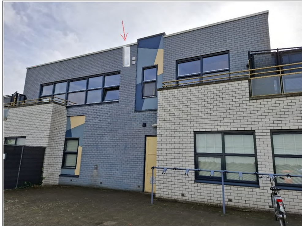
Foto 3. Locatie van de aan te brengen vleermuiskast aan de noordzijde van Kinderopvang Heyendael.