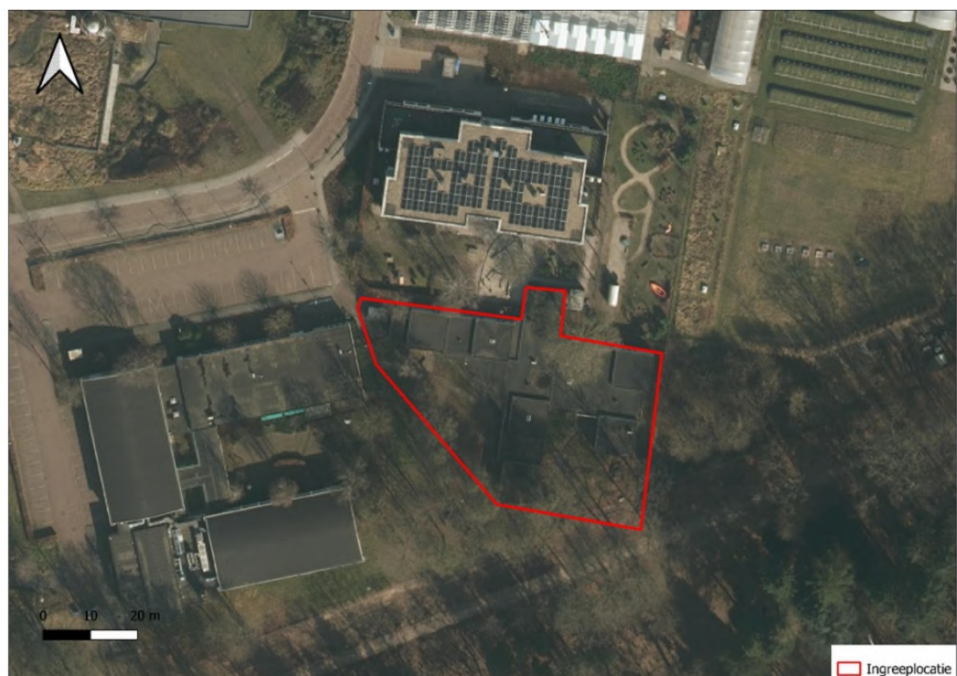
Figuur 1. Ligging en begrenzing van de ingreeplocatie de Gele Vlieger te Nijmegen.

De ingreeplocatie betreft voormalige kinderopvang de Gele Vlieger, gelegen aan Toernooiveld 9 te Nijmegen (figuur 1). Dit is een uit bakstenen opgetrokken gebouw met plat dak op het campusterrein van de Radboud Universiteit. Binnen de ingreeplocatie bevinden zich diverse bomen, struiken en sierbeplanting. Ten noorden en westen van de ingreeplocatie bevinden zich gebouwen, parkeerplaatsen en wegen behorende tot het campusterrein. Ten oosten zijn onderzoekstuinen gelegen. Ten zuiden van de ingreeplocatie bevindt zich Park Brakkenstein.