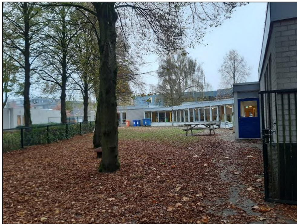
Foto 1. Speelplaats en zuidwestgevel van de Gele Vlieger. Gefotografeerd richting het noorden.