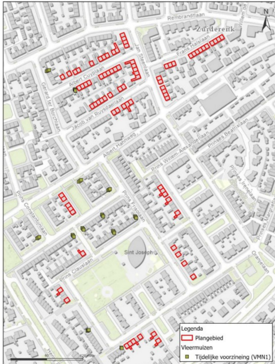
Figuur 3 tijdelijke alternatieve voorzieningen gewone dwergvleermuis.