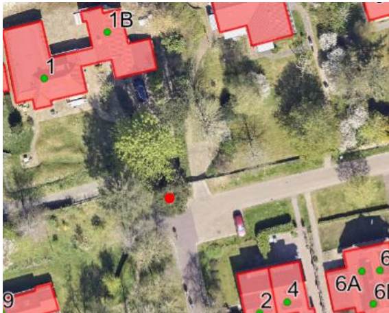
Ligging Grove den bij rode stip

Ligging: de Grove den staat aan de Reddingsweg tussen de inritten van nrs. 1A en 1B (kadastraalperceel SMN01B3224).