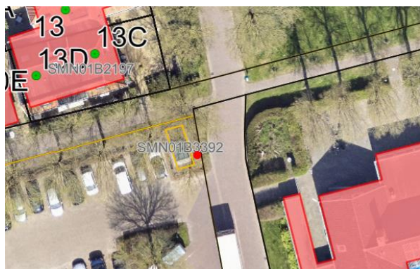
Ligging iep bij rode stip

Ligging: de iep staat tussen het trafostation van Liander en de Burgemeester van den Wormstraat (kadastraalperceel SMN01B3391).