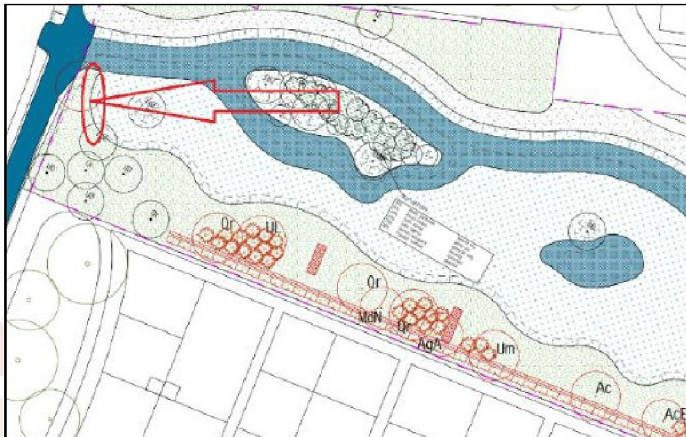
Figuur 2: Positie oeverwaluwand (rode cirkel). De boom ten oosten van de oeverwaluwand wordt op een andere locatie geplaatst.