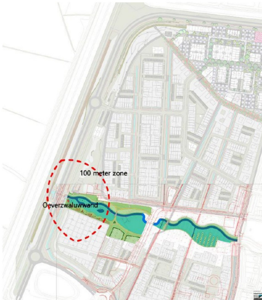
Figuur 4: Bufferzone rondom de oeverwaluwand (rode stippellijn). Versturende werkzaamheden in deze bufferzone worden buiten het broedseizoen (globaal 1 maart – 15 september) uitgevoerd.