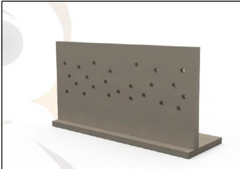
Figuur 3: Oeverwaluwand die in het beekpark is geplaatst.