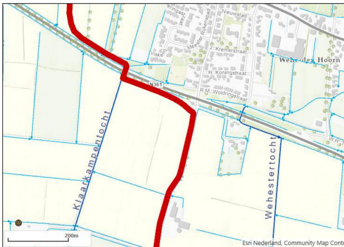
Figuur 3 - Beperkingengebied C-III persleiding (rode streep = 20 meter brede zone rondom de persleiding)