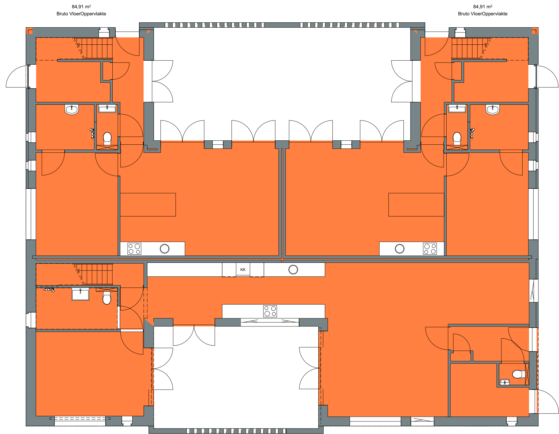
BEGANE GROND (BVO) 1:100