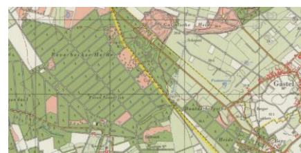
Figuur 4. Rond 1980