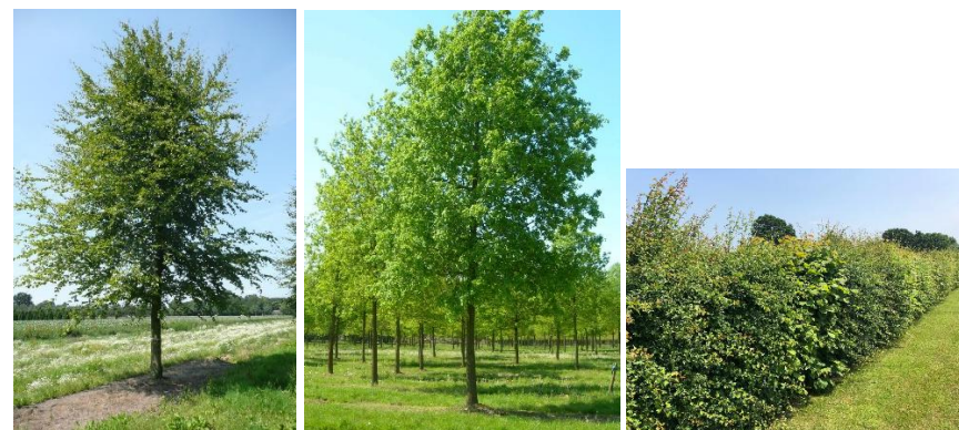
Figures 10 t/m 12 impressies groen

Aan de achterzijde van de kassen wordt een gemengde, inheemse struweelhaag aangelegd als natuurlijke overgang naar het achterliggende bosgebied. Deze struweelrand heeft een geleidelijk opgaande structuur met diverse hoogteniveaus, van lage struiken tot hoger opgaande soorten. Een gemengde haag bieden een rijk palet aan bloei, besvorming en dekking door het jaar heen. De haag fungeert als ecologische stapsteen en voedselbron voor vogels, insecten en kleine zoogdieren, en draagt bij aan het versterken van lokale biodiversiteit. Door de aansluiting met het bestaande bos wordt ook de ecologische samenhang in het gebied vergroot.