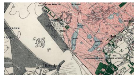
Figuur 2. Rond 1915

De gronden rondom de planlocatie zijn in de loop der tijd steeds mee ingericht voor de agrarische sector. Waar het gebied rond 1915 nog natuur was is dit rond 1980 al voornamelijk in agrarisch gebruik