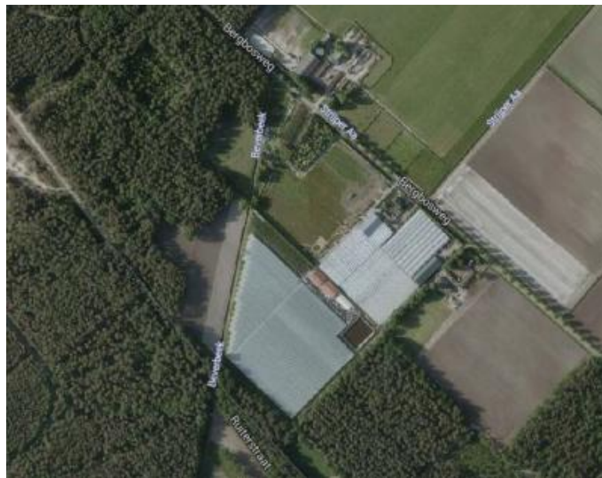
Figuur 1. Luchtfoto planlocatie