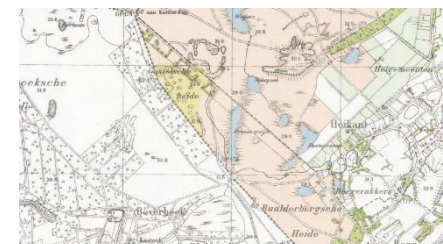
Figuur 3. Rond 1950