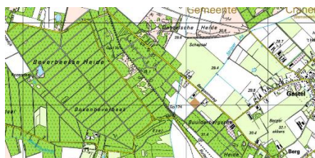
Figuur 5. Rond 2000