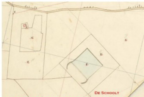
Kaart Kadastrale minuut 1832 (Eendenkooien.nl)

Vanwege de hoge ouderdom en de sterke relatie met het omliggende gebied en Huis Dorth heeft de eendenkooi een hoge cultuurhistorische waarde.