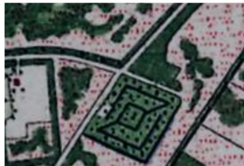
Bonnebladen 1900