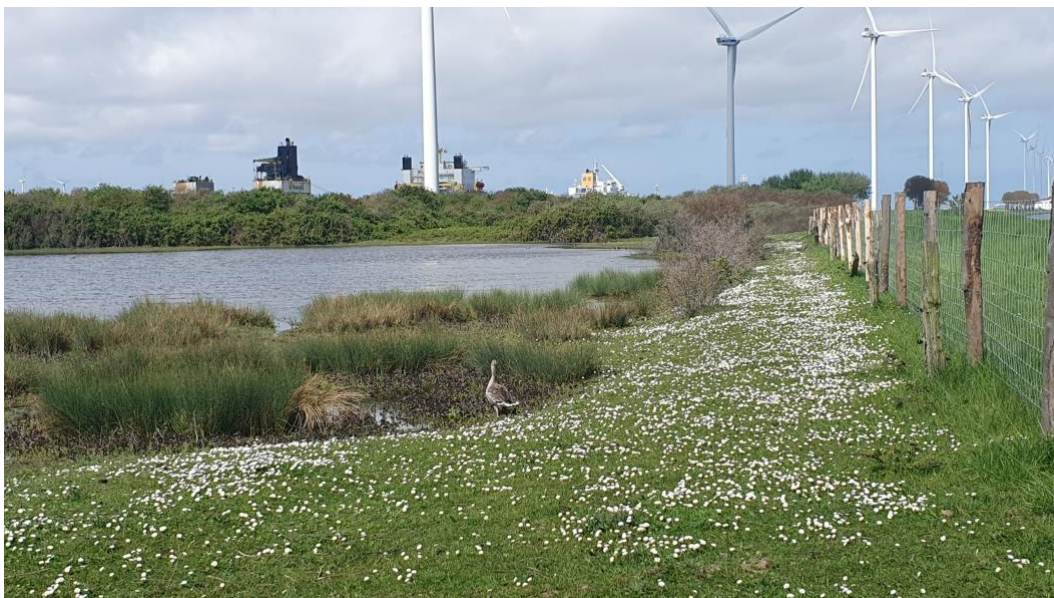
Figuur 3.2 Grauwe gans en zicht op de noord- en westzijde van de poel.

Het plangebied, en dan specifiek het struweel, vormt geschikt broedbiotoop van algemeen voorkomende vogels waarvan de nestplaats niet jaarrond beschermd is. Tijdens het veldbezoek zijn (zoals hierboven vermeld) nesten van grauwe gans vastgesteld in het struweel rondom de poel.