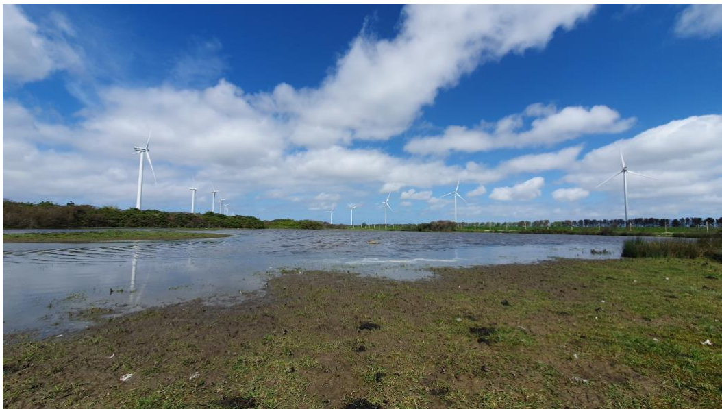
Figuur 3.1 Kale oevers langs de zuidoostzijde van de poel.