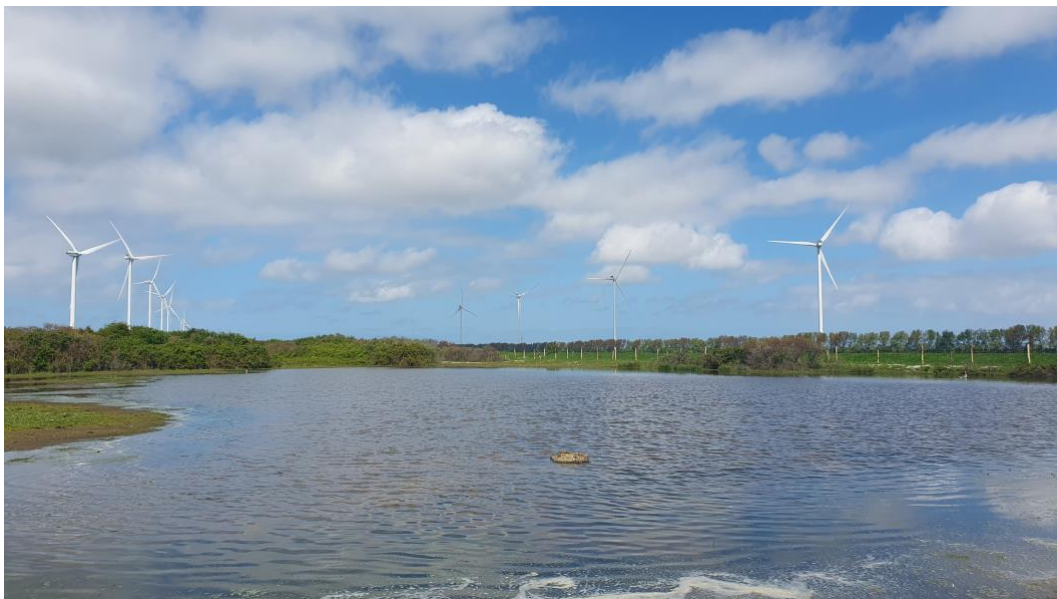
Figuur 2.3 Foto van de te dempen poel, zicht richting het noordwesten.