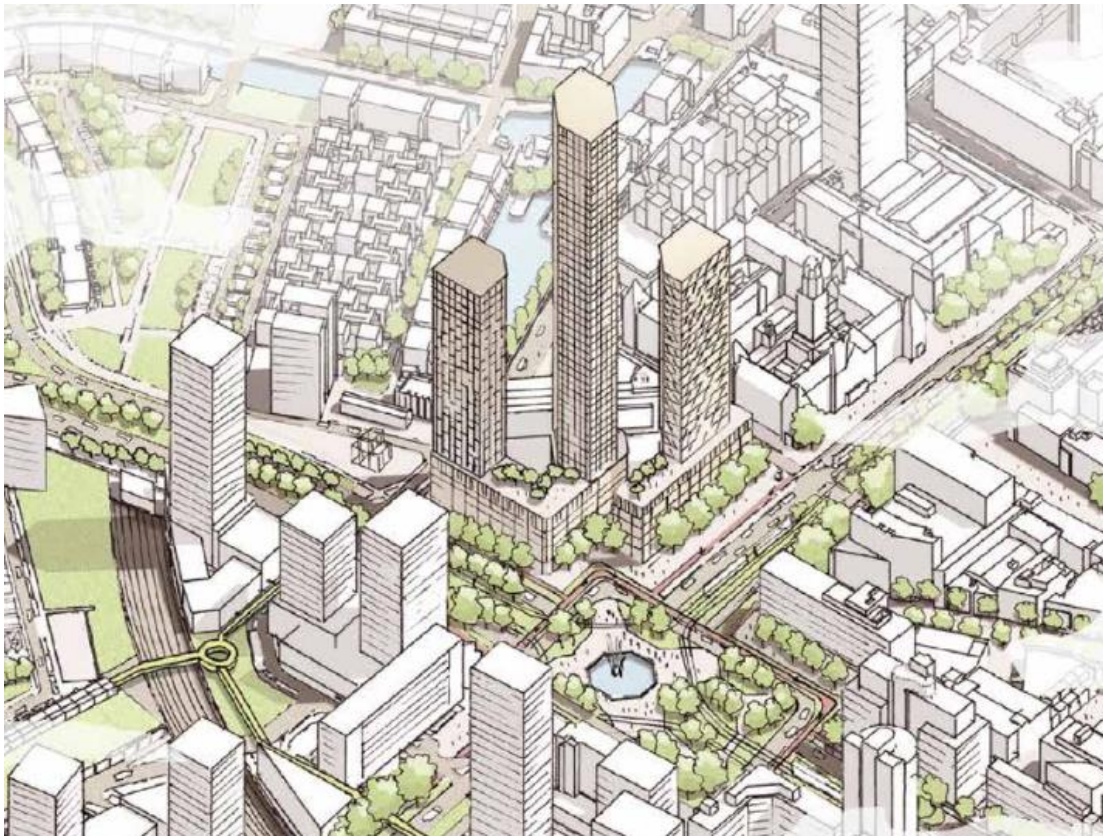
Figuur 1: Planlocatie RISE gezien vanaf het noordwesten, van links naar rechts: Weenatoren, Hofpleintoren en Coolsingeltoren.

De locatie staat hieronder op de kaart vermeld en in de bijlage bij het akoestisch onderzoek.