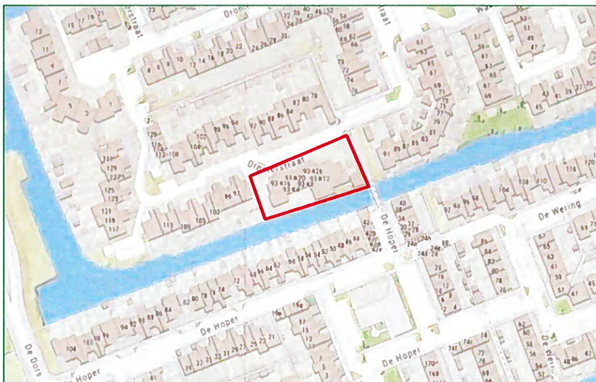
Weergave plangebied (rood omlijnd).