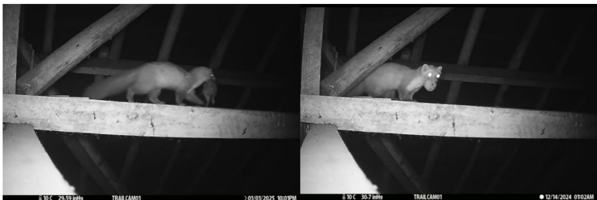
Foto's: Steenmarter met voedsel, links met een rat en rechts met een vetbol.

De steenmarter is op verschillende momenten vastgelegd op camerabeelden, zie tabel 1. Voornamelijk in de eerste helft van het onderzoek is de steenmarter vaak waargenomen, aan het einde van de onderzoeksperiode namen de waarnemingen af. Op de beelden is te zien dat de steenmarter gebruik maakt van de balkenconstructie om zich te verplaatsen. De soort is hier ook meerdere keren met voedsel (drie keer een rat en één keer een vetbol voor vogels) voorbij gekomen.