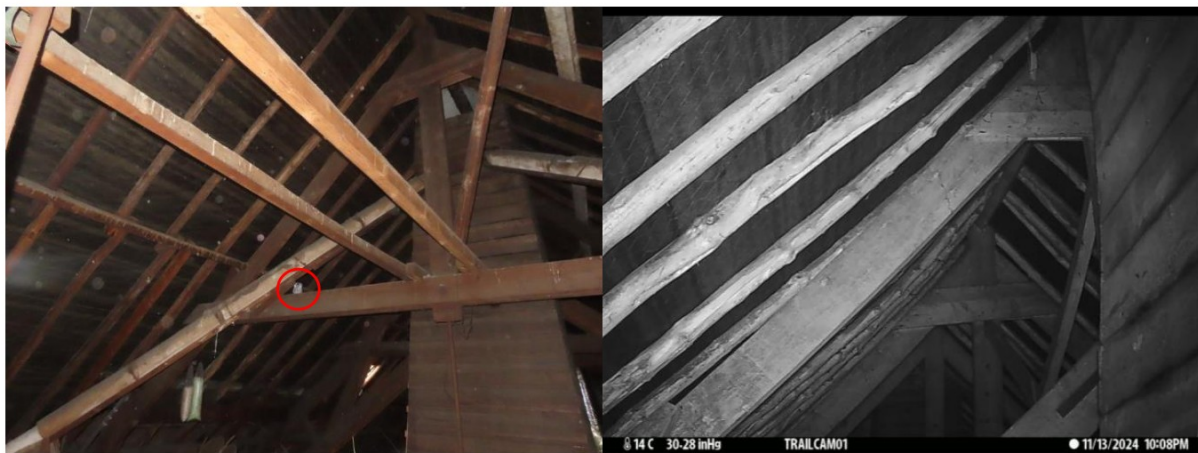
Foto's: Geplaatste camera's (links) en overzicht van camerabeeld (rechts).

Tijdens het cameraonderzoek, uitgevoerd in de periode 27 september 2024 -22 mei 2025, zijn er geen waarnemingen van vleermuizen gedaan. Daarnaast zijn er ook geen exemplaren aangetroffen tijdens de bezoeken. De camera's zijn op verschillende locaties op de zolder geplaatst, waardoor een volledig beeld van de ruimte is verkregen.