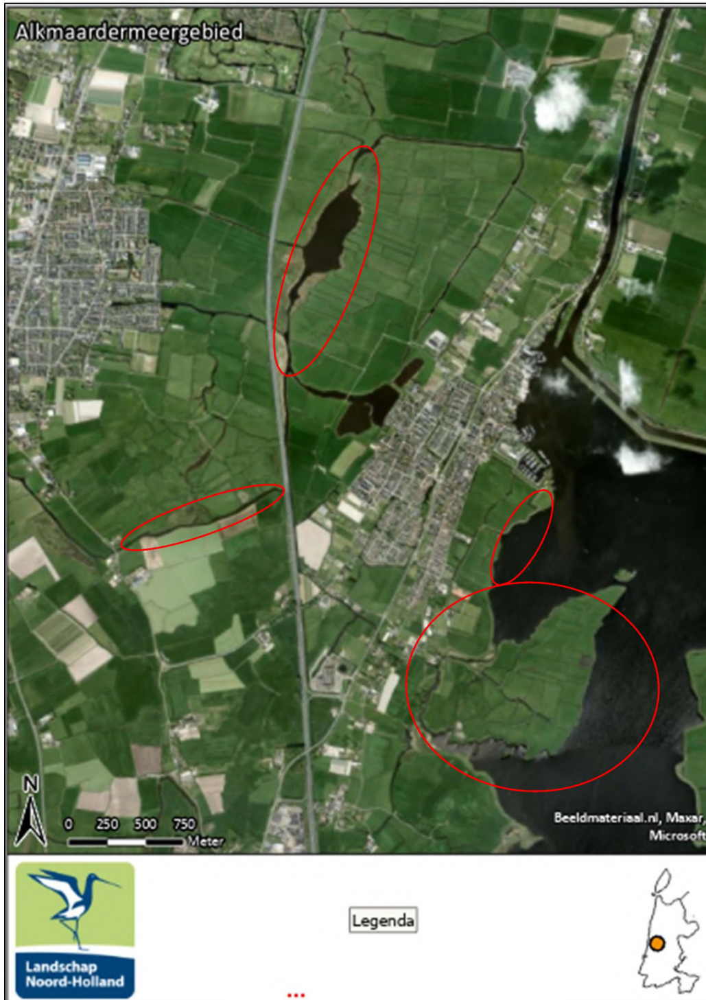
Figuur 1 Deelgebieden Alkmaardermeergebied. Zie bijlage voor meer specifieke oevers waar we riet willen branden

Onderbouwing riet maaien en afvoeren d.m.v. branden