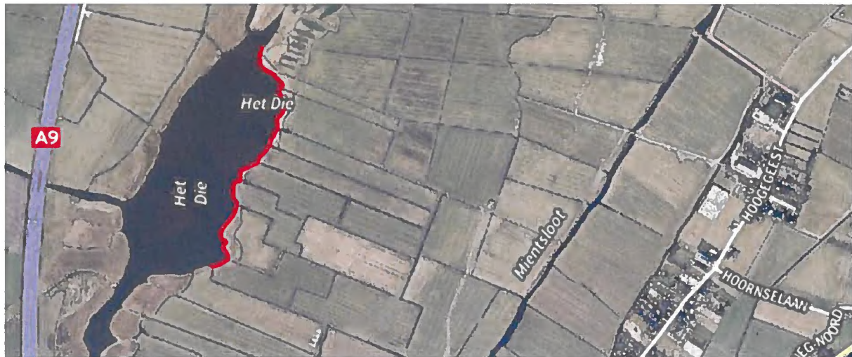
Luchtfoto met de brandlocatie (aangegeven met de rode lijn) in 'Het Die' Groot-Limmerpolder en omliggende bebouwing.

Vanuit de aangevraagde mba het verbranden van riet zal geuremissie plaatsvinden. Om geuroverlast zoveel mogelijk te beperken voor omwonenden zijn er voorschriften aan de vergunning verbonden met betrekking tot de windrichting, de windkracht en geurhinder (rookontwikkeling). Omdat het riet in de betreffende (natuur)gebieden in de open lucht wordt verbrand, zijn nadere maatregelen niet mogelijk. Gelet op voorgaande wordt hierbij dus voldaan aan de BBT.