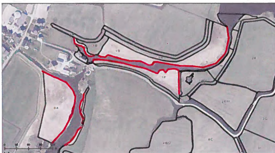
Locaties verbranden rietmaaisel in de Hempolder

De locaties in 'Het Die' Groot-Limmerpolder zijn kadastraal bekend als: