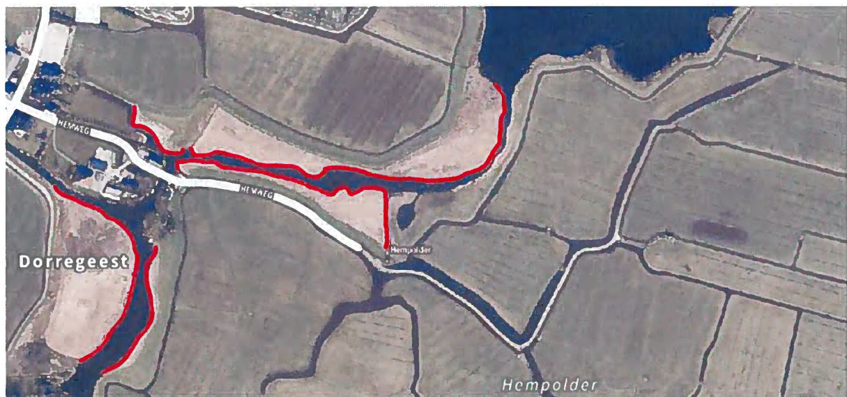
Luchtfoto met brandlocaties (aangegeven met de rode lijnen) in de Hempolder en omliggende bebouwing.