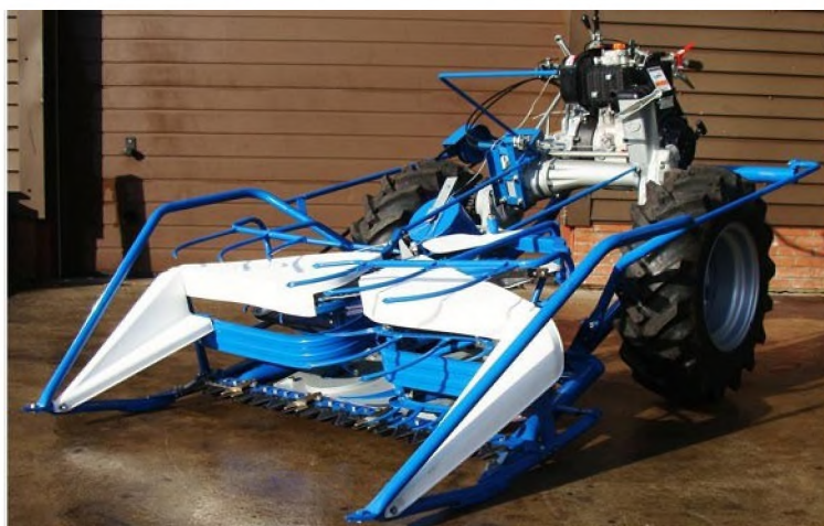
Voorbeeld van een bsc rietbinder

https://youtu.be/l1aSkRks2LE?si=PEbzXyeFcAYw01UV