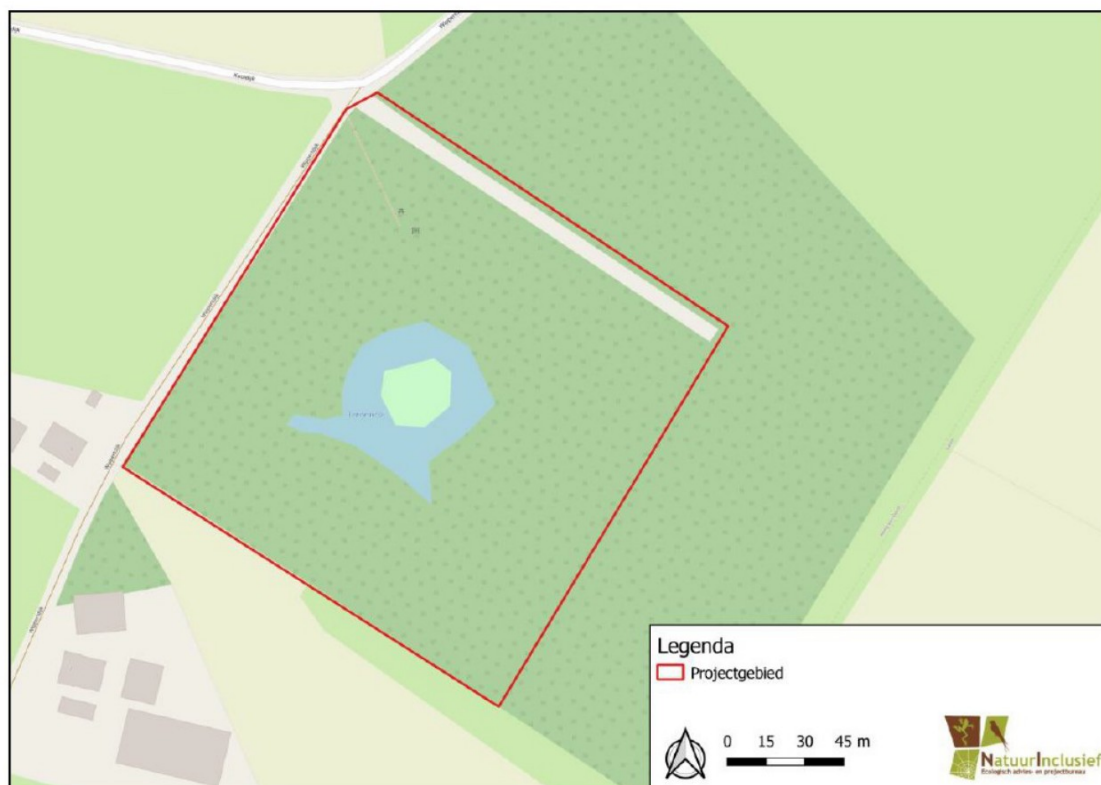
Figuur 1. Ligging plangebied op de hoek van de Wippertdijk en de Kooidijk te Kring van Dorth.