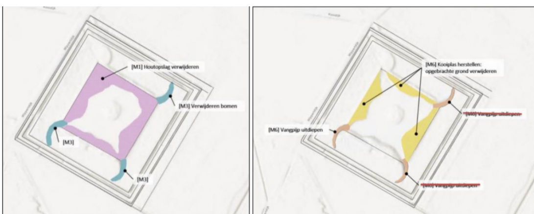
Figuur 2. Overzicht van de uit te voeren werkzaamheden. Links : verwijderen houtopslag. Rechts : te verwijderen grond. De initiatiefnemer heeft ervoor gekozen om alleen vangarm 3 uit te diepen. Vangarm 1 wordt dermate hersteld dat deze herkenbaar is als vangarm, maar er zullen geen hekken om geplaatst worden en de vangarm wordt niet uitgediept. Alleen bij de aansluiting van de vangarm op de plas zal wat grond worden verwijderd om de toevoer van water naar de arm te bevorderen.