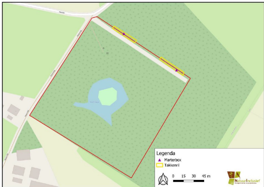
Figuur 3. Locaties met de te realiseren marterhopen met marterbox en de aansluitende takkenrillen.