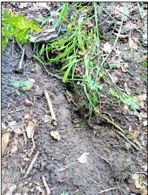
Figuur 4.1 Recente graafsporen van das.

Ook zijn er recente neusputjes en (graaf)sporen aangetroffen van das (figuur 4.1-4.3), inclusief het begin van een nieuwe ingang (figuur 4.4.) Er kan hierdoor geconcludeerd worden dat de minimale beschadigingen en mogelijke verstoring van de burcht door eerdere werkzaamheden de das(sen) niet verjaagd hebben.