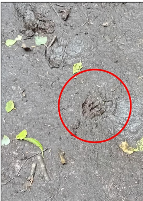
Figuur 4.2 Pootafdruk das onderaan de burcht.