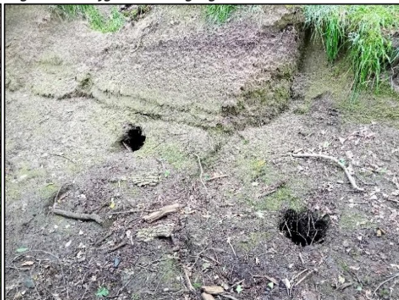
Figuur 3.8 Door droogte toegankelijke ingangen.

Ook zijn er recente neusputjes en (graaf)sporen aangetroffen van das (figuur 4.1-4.3), inclusief het begin van een nieuwe ingang (figuur 4.4.) Er kan hierdoor geconcludeerd worden dat de minimale beschadigingen en mogelijke verstoring van de burcht door eerdere werkzaamheden de das(sen) niet verjaagd hebben.