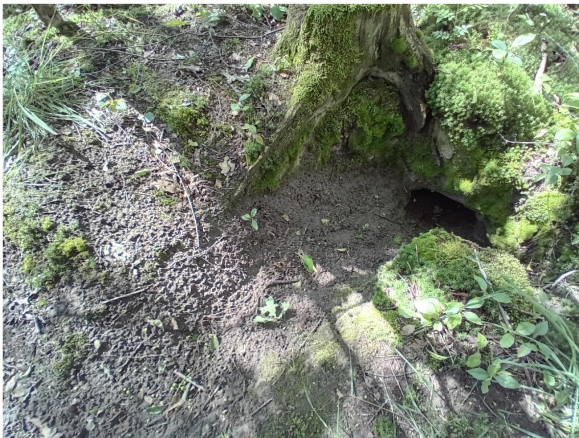
Figuur 4.3 Recente graafsporen bij een al bestaande ingang.