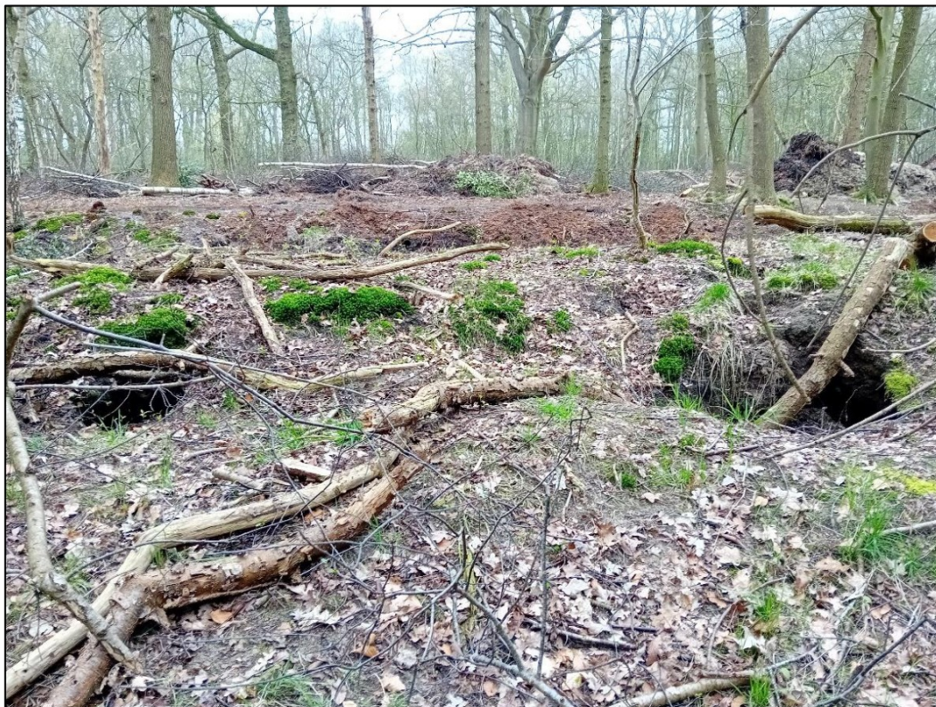
Figuur 2.1: Dassenburcht vanaf oostzijde gezien, met takken die enkele uitgangen blokkeren voorafgaand aan de werkzaamheden.