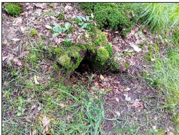
Figuur 3.3 Vrijgemaakte ingang