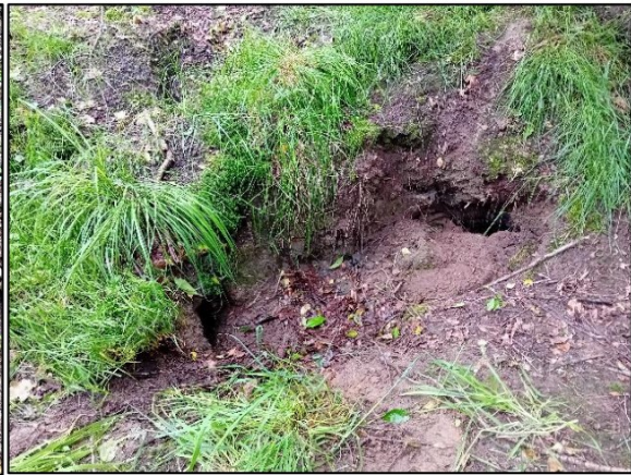
Figuur 3.2 Vrijgemaakte ingang