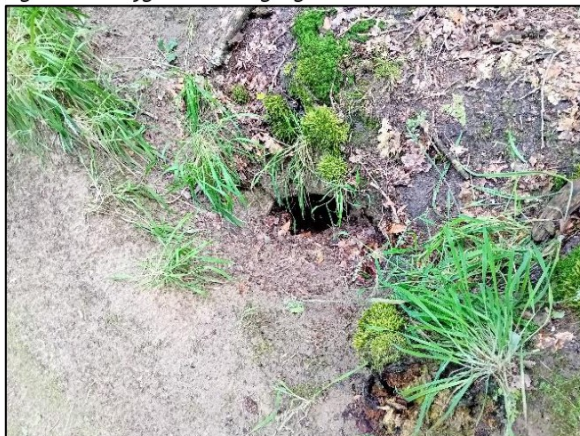
Figuur 3.7 Vrijgemaakte ingang.