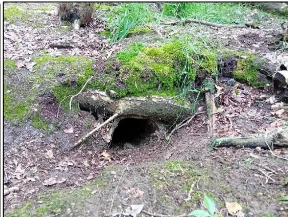
Figuur 3.6 Vrijgemaakte ingang