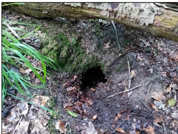
Figuur 3.5 Vrijgemaakte ingang.