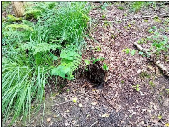
Figuur 3.1 Vrijgemaakte ingang.

Alle zichtbare openingen zijn weer toegankelijk gemaakt, zie figuur 3.1 - 3.8. In enkele hollen lijken op foto's nog takken aanwezig (zie figuur 3.4 bijvoorbeeld), dit zijn echter boomwortels en waren al aanwezig voor de snoeiwerkzaamheden. Door het droogvallen van de sloot zijn enkele andere ingangen ook weer toegankelijk geworden, zie figuur 3.8.