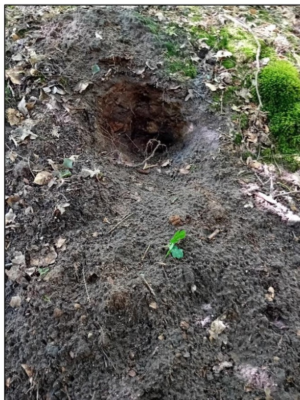
Figuur 4.4 Begin van graafwerkzaamheden aan nieuwe ingang.