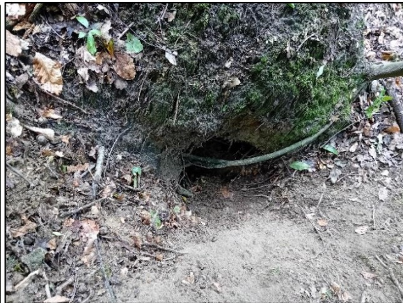
Figuur 3.4. Opening met een boomwortel erdoorheen.