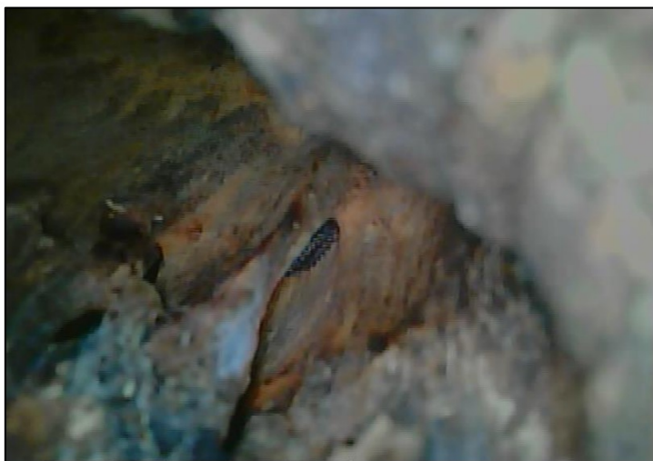
Figuur 6. Endoscopische opname van de holte in boom 14.