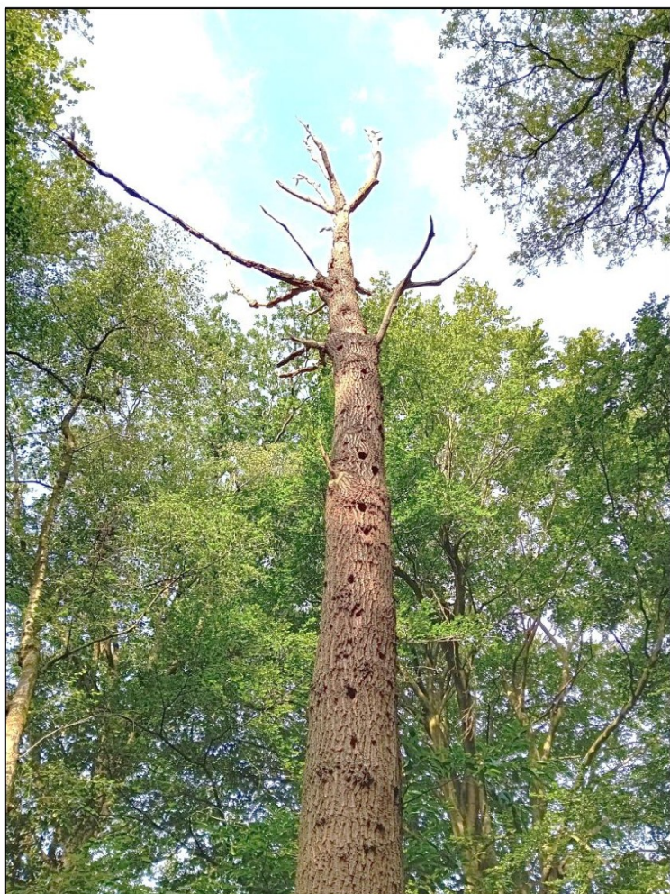
Figuur 3. Boom 5.