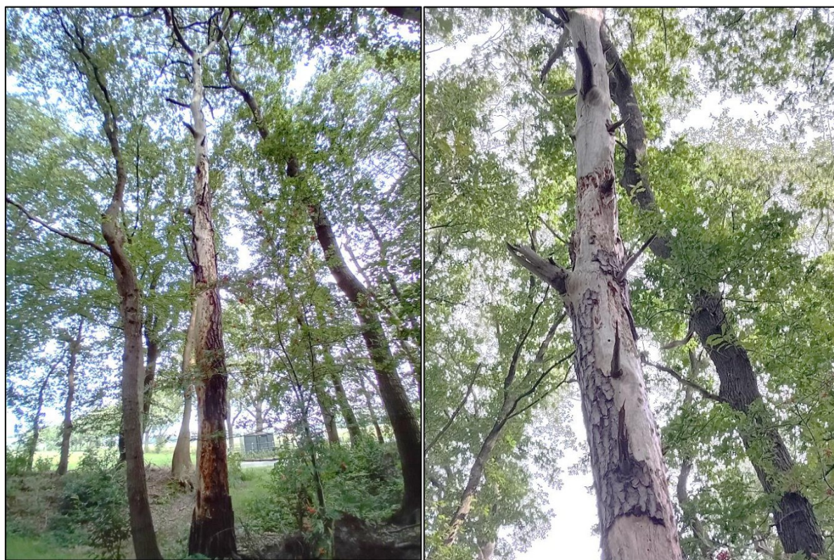
Figuur 2. Boom 1.

Boom 1 is een oude, stervende grove den met vele (spechten)gaten en loszittend schors (zie figuur 2). [REDACTED] is echter van plan om enkel de gevaarlijke takken te verwijderen en de stam met holtes te laten staan. Hierdoor wordt voorkomen dat mogelijke verblijfplaatsen van gebouwbewonende soorten vernietigd raken en hoeft enkel voor de kap van de gevaarlijke takken een check uitgevoerd te worden van de holtes. Indien er geen vleermuizen of andere soorten aanwezig zijn in de holtes, kunnen de takken verwijderd worden.