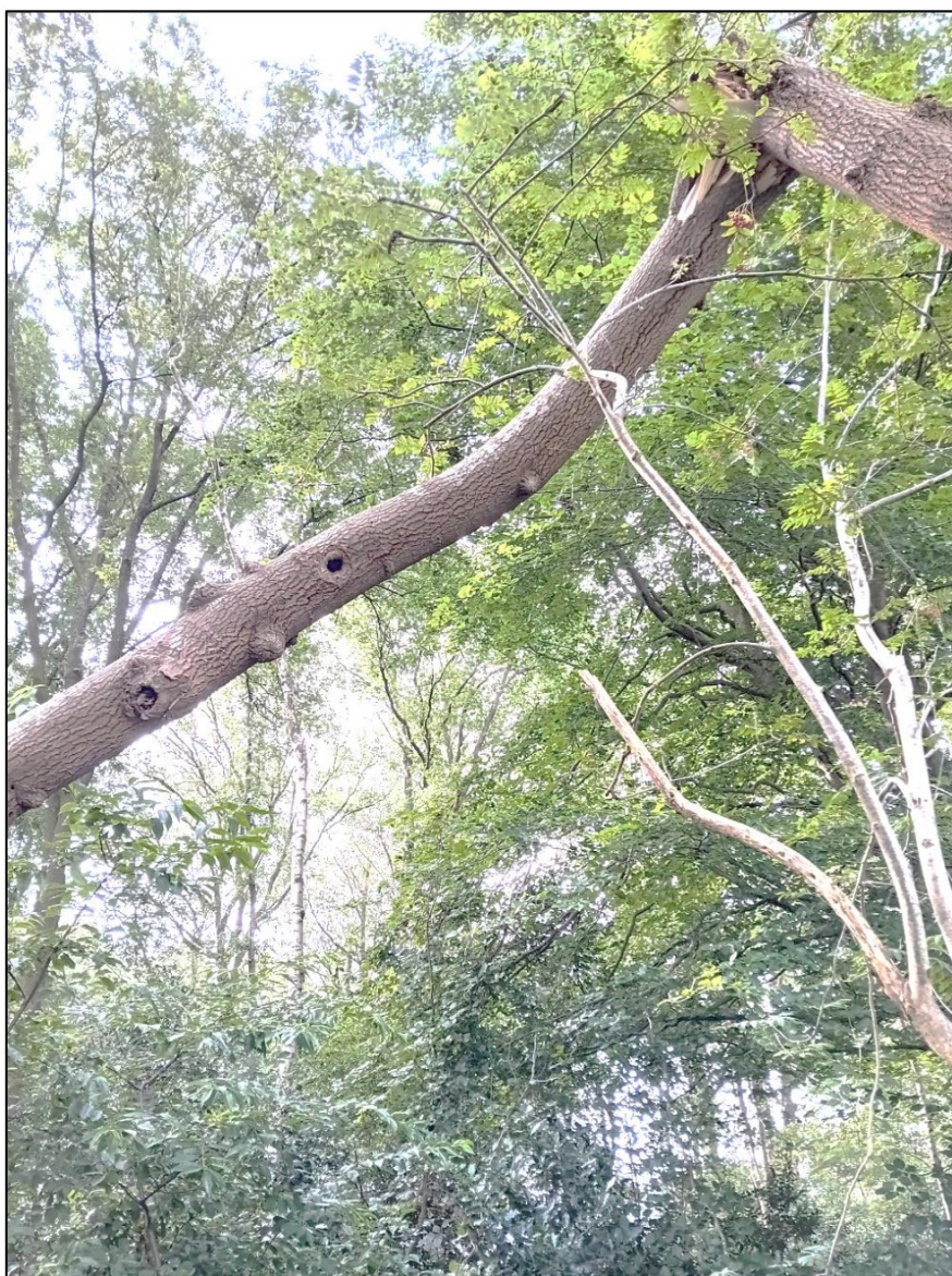
Figuur 5. Boom 14.