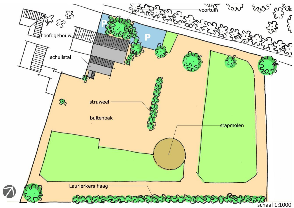
Figuur 6: bestaande situatie