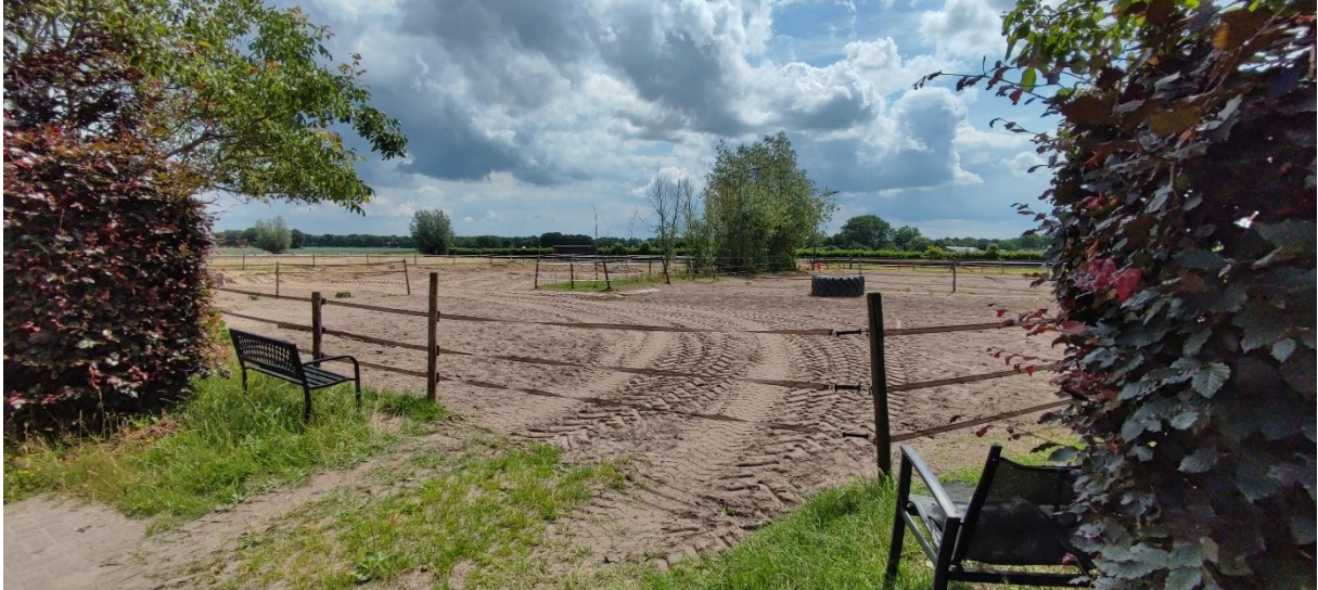
Foto 1 paardenbak met struweel

Op het perceel staan ongeveer 8 bomen, 2 Esdoorns in de voortuin, 2 notenbomen ten noorden van de kopgevel, een kastanjeboom in de noordwesthoek van het perceel, een appelboompje en wilg waarvan de meeste ca. 5 meter hoog. De vruchtdragende bomen zijn aantrekkelijk voor vogels. Naast het parkeerterrein staan ook een vijftal jonge wilgen die recent zijn aangeplant.