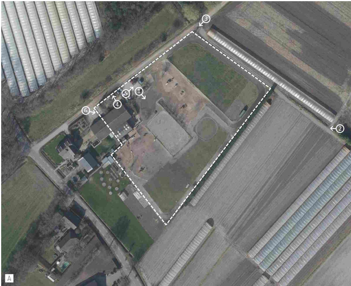
Figuur 1: luchtfoto van de situatie met daarop aangegeven de foto locaties die in het plan worden getoond.

Een paddock is dus een diervriendelijke paardenhouderij waar het welzijn van de dieren voorop staat. Het achter en naast het gebouw liggende erf (kadastrale kaart 1726) met agrarische bestemming wordt ook gebruikt voor de paddock. In overleg met de gemeente is besloten de huidige situatie te legaliseren om zo het bestaande gebruik als paddock, formeel, toe te staan.