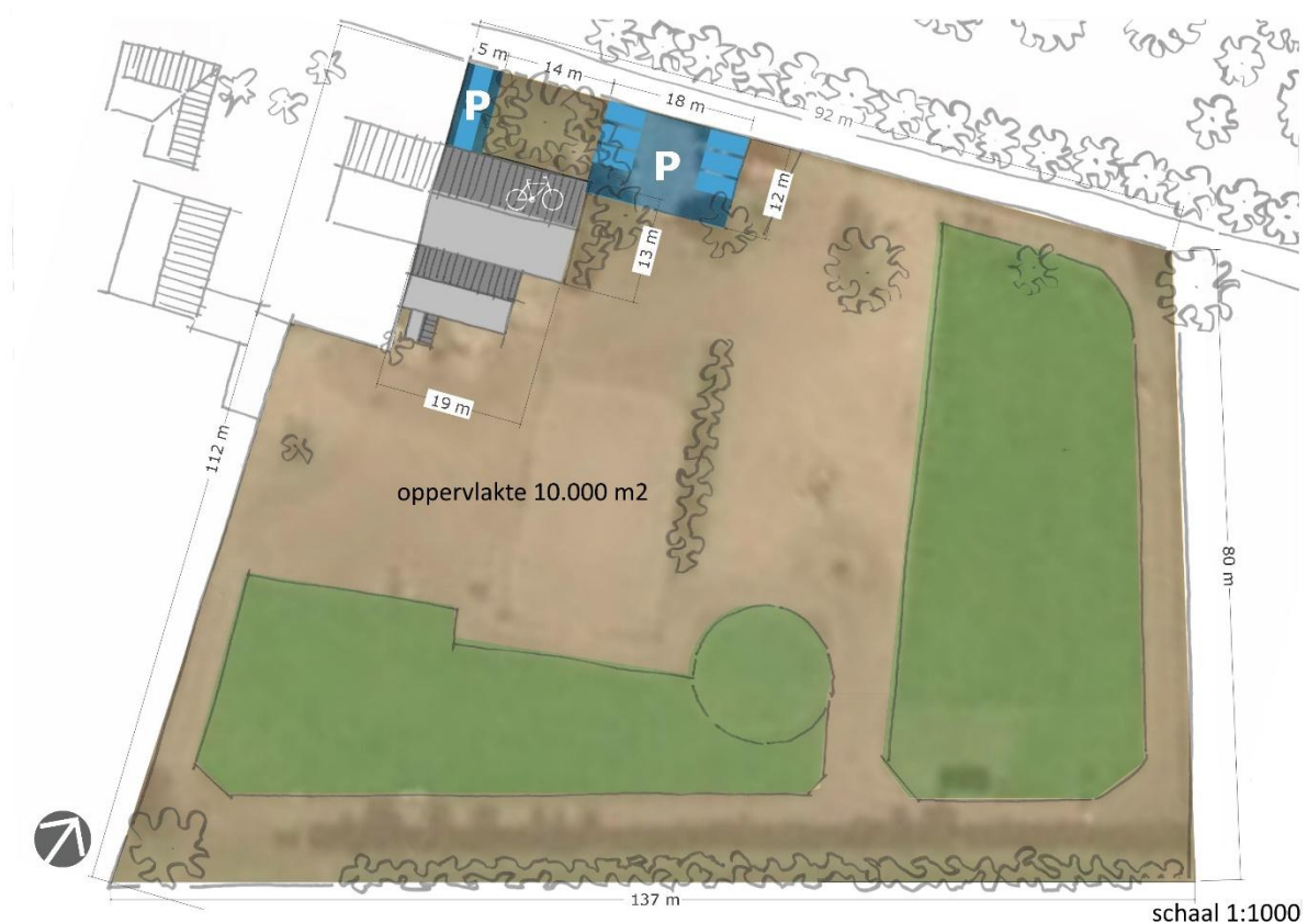
Figuur 5: plattegrond met parkeerplaatsen en afmetingen perceel.