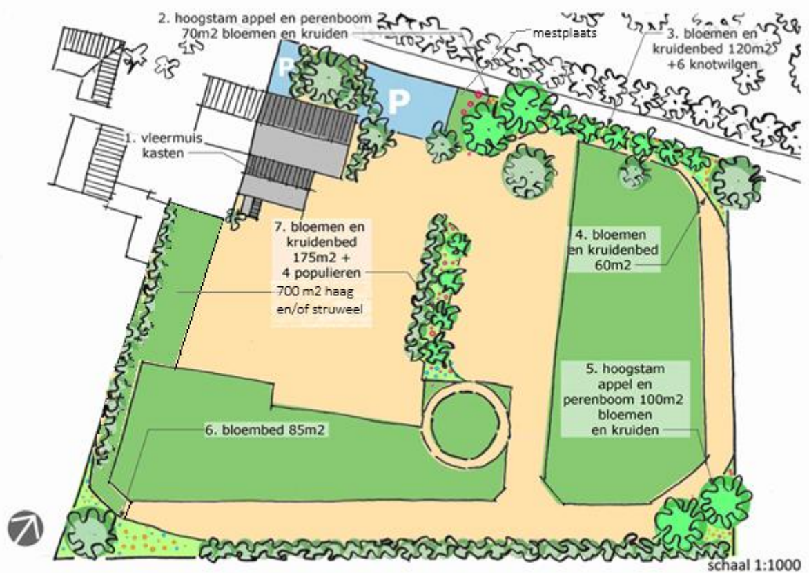
Figuur 7: nieuwe situatie