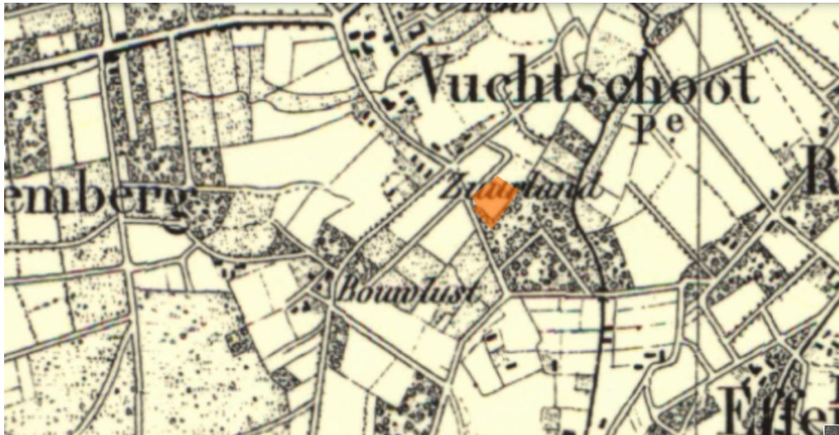
Figuur 2: kaart uit 1865 met hierop de Vuchtschootseweg en het projectgebied in oranje weergegeven