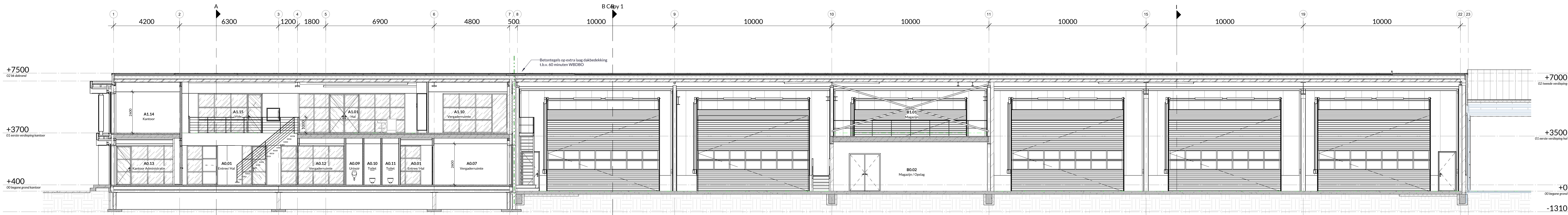
Doorsnede D 1:100