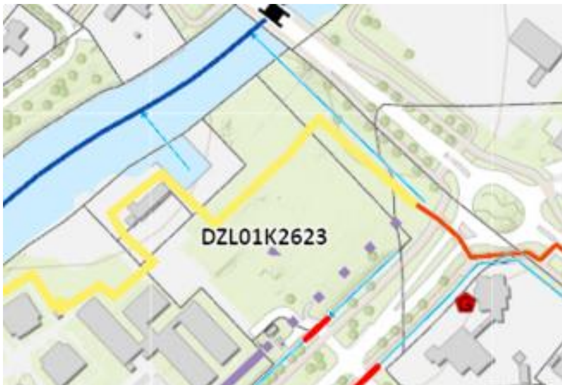
Figuur 2: de in geel aangegeven lijn vervalt als waterkeringslijn. De met paars en gestippeld paars (ontwikkeling perceel kadastraal bekend als gemeente Delfzijl, sectie K, nummer 2623) aangegeven lijn geeft de nieuwe administratieve ligging van de waterkeringslijn aan.