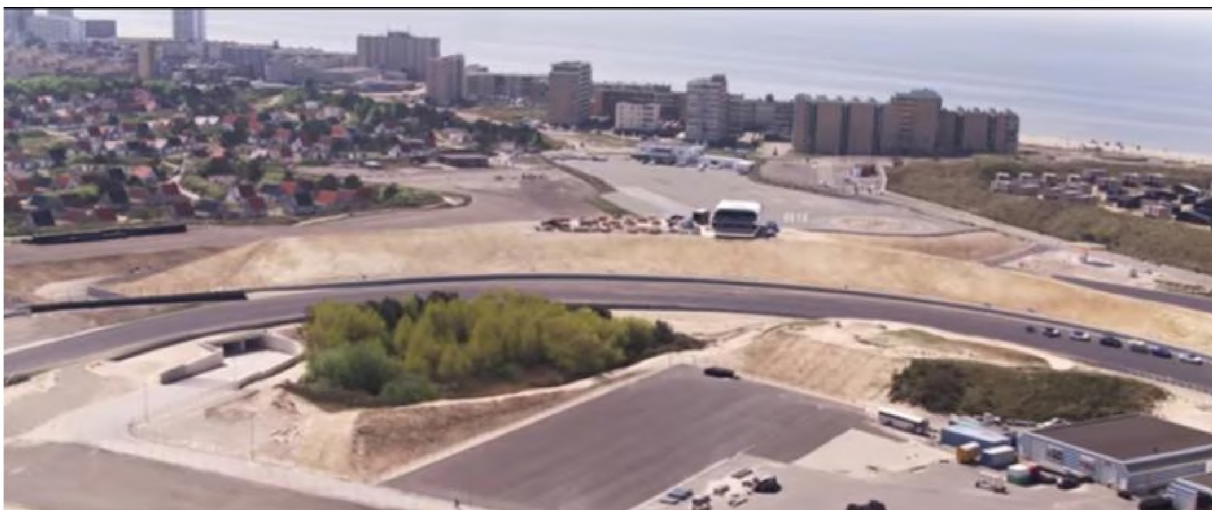
Figuur 1 Status reservaatgebied 1 in 2020 (foto vanuit het noordoosten).

Reservaatgebied 2 is ingesloten tussen de baan met crashbarrière aan de oostzijde en een grote verharde parkeerplaats aan de westzijde. Een aansluiting met leefgebied bestaat uit een smalle verbinding aan de zuidzijde. Zandhagedissen migreren niet over grotere afstanden en zijn vrij plaatsgebonden. Het is ook geen pionierssoort zoals de rugstreeppad. De maatregelen die getroffen zijn om het gebied geschikter te maken zijn o.a. de plaatselijke aanplant van struiken en helm en de installatie van een waterbekken. De pionierssoort rugstreeppad heeft inmiddels het reservaatgebied ontdekt en gekoloniseerd. Dit geeft aan dat de leefomstandigheden inmiddels geschikt zijn. Zoals te verwachten zal de zandhagedis meer tijd voor nodig hebben voor een colonisatie.