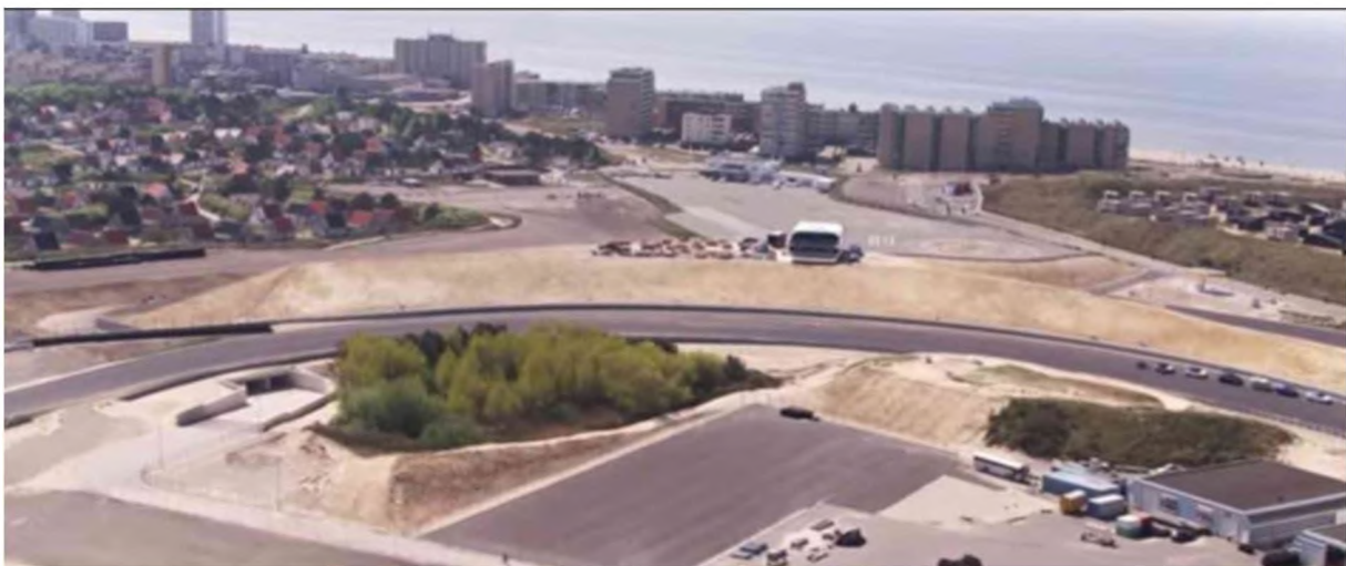
Figuur 1 Status reservaatgebied 1 in 2020 (foto vanuit het noordoosten).

Reservaatgebied 2 is ingesloten tussen de baan met crashbarrière aan de oostzijde en een grote verharde parkeerplaats aan de westzijde. Een aansluiting met leefgebied bestaat uit een smalle verbinding aan de zuidzijde. Zandhagedissen migreren niet over grotere afstanden en zijn vrij plaatsgebonden. Het is ook geen pionierssoort zoals de rugstreeppad. De maatregelen die getroffen zijn om het gebied geschikter te maken zijn o.a. de plaatselijke aanplant van struiken en helm en de installatie van een waterbekken. De pionierssoort rugstreeppad heeft inmiddels het reservaatgebied ontdekt en gekoloniseerd. Dit geeft aan dat de leefomstandigheden inmiddels geschikt zijn. Zoals te verwachten zal de zandhagedis meer tijd voor nodig hebben voor een colonisatie.