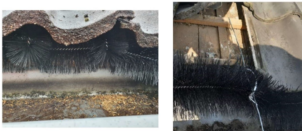
Figuur 4: Dichtzetten van goot met spouwborstels. Borstels met harde haren (maximaal 12 centimeter doorsnede) en korte borstels in holtes om goed af te dichten (links). Vastzetten met borstelhaak ter voorkoming loshalen door vogels of marters (rechts).