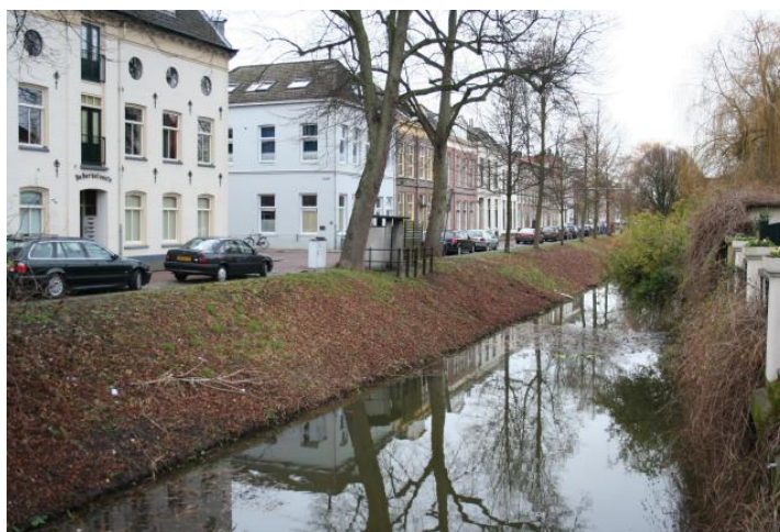
▲ Het urinoir staat op de Berkeloever.