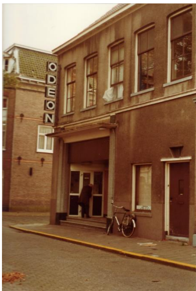
▲ Bioscoop Odeon circa 1985.