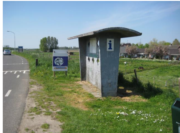
▲ Voormalige bushalte-wachtplaats in Batenburg, in gebruik als informatiepunt voor wandelaars. Gemaakt van prefab betonelementen. Fabrikant en datering onbekend.