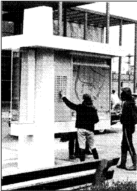
▲ Tussen 1965 en 1970 werd op het Stationsplein in Zutphen dit betonnen informatiepunt geplaatst. In een vergelijkbare vormgeving verschenen in die periode in de binnenstad verlichtte uitstalkasten. Het voorbeeld aan het Stationsplein is reeds vóór de herinrichting (2005-2007) van het plein verwijderd.