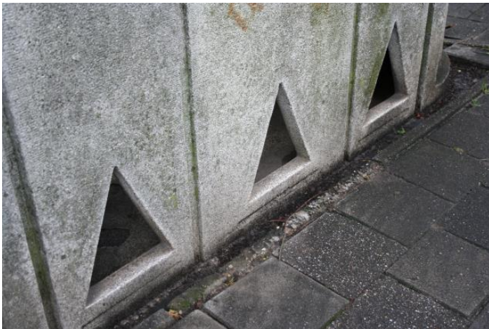
▲ De panelen rusten op een betonnen funderingsplaat. Ook langs de openingen is een frijnslag aangebracht.