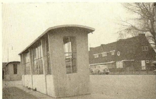
Gemeenteveren Amsterdam overzijde IJ

Uitvoerige inlichtingen en tekeningen op aanvraag.