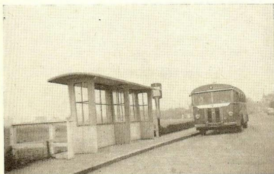
Abri eindpunt Gem. Tram Sloten (Amsterdam)