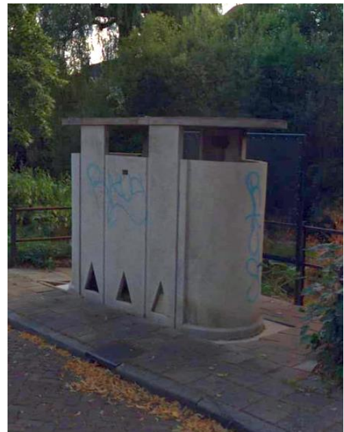
▲ Het urinoir in 2023.