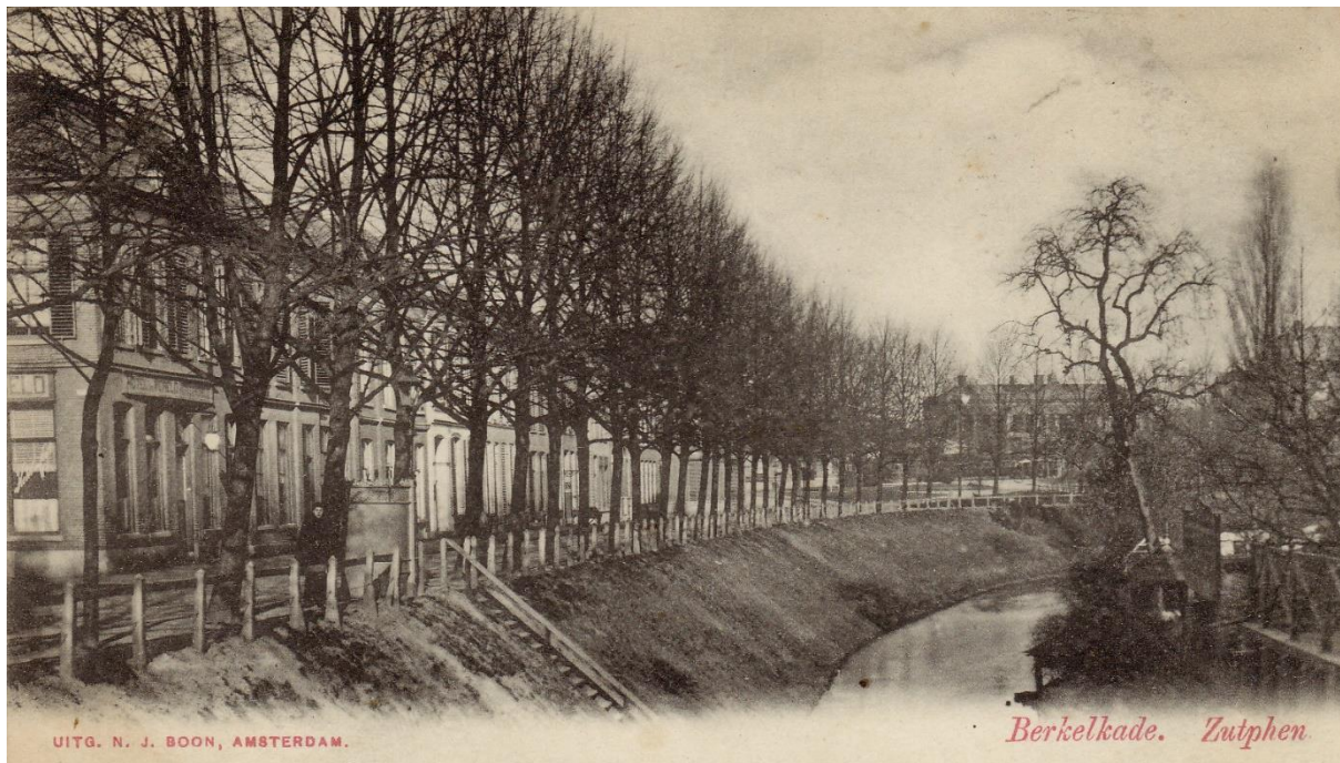
▲ Ansichtkaart met zicht op de Berkel en Berkelkade vanaf de Marspoortbrug. Geheel links op de hoek met het straatje Oude Wed het pand Berkelkade 13 waar tot 1912 hotel De Wereld was gesitueerd. In dat jaar werd de eerste bioscoop op die plek geopend. Schuin tegenover het hotel de plaatstalen voorganger van het huidige urinoir.