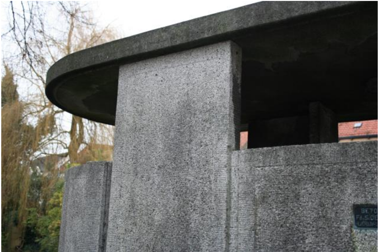
▲ Detail van de dakopbouw van het urinoir. De vlakken zijn rondom voorzien van een nabewerking met frijnslag.