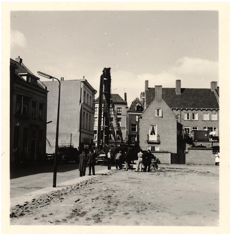
◀ Groenmarkt 2-4 vanaf het bouwterrein aan de Waterstraat. Foto 1950-1955.