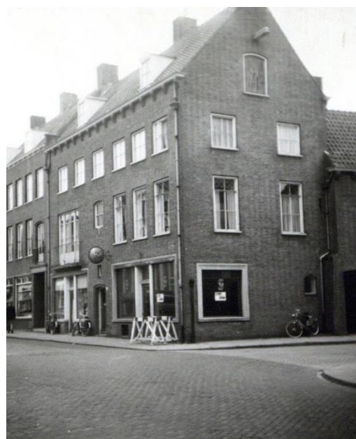
▲ Groenmarkt 2-4 voor de aanpassing van de linker winkelpui. Foto 1955-1970