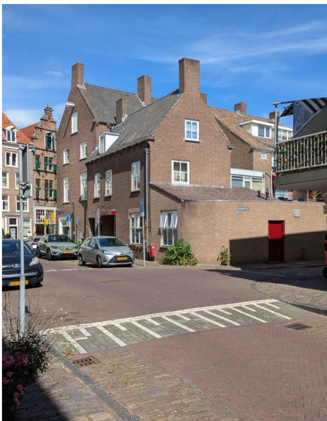
▲ Het pand met de uitbreiding uit 1979 op de hoek Waterstraat – Kolenstraat.