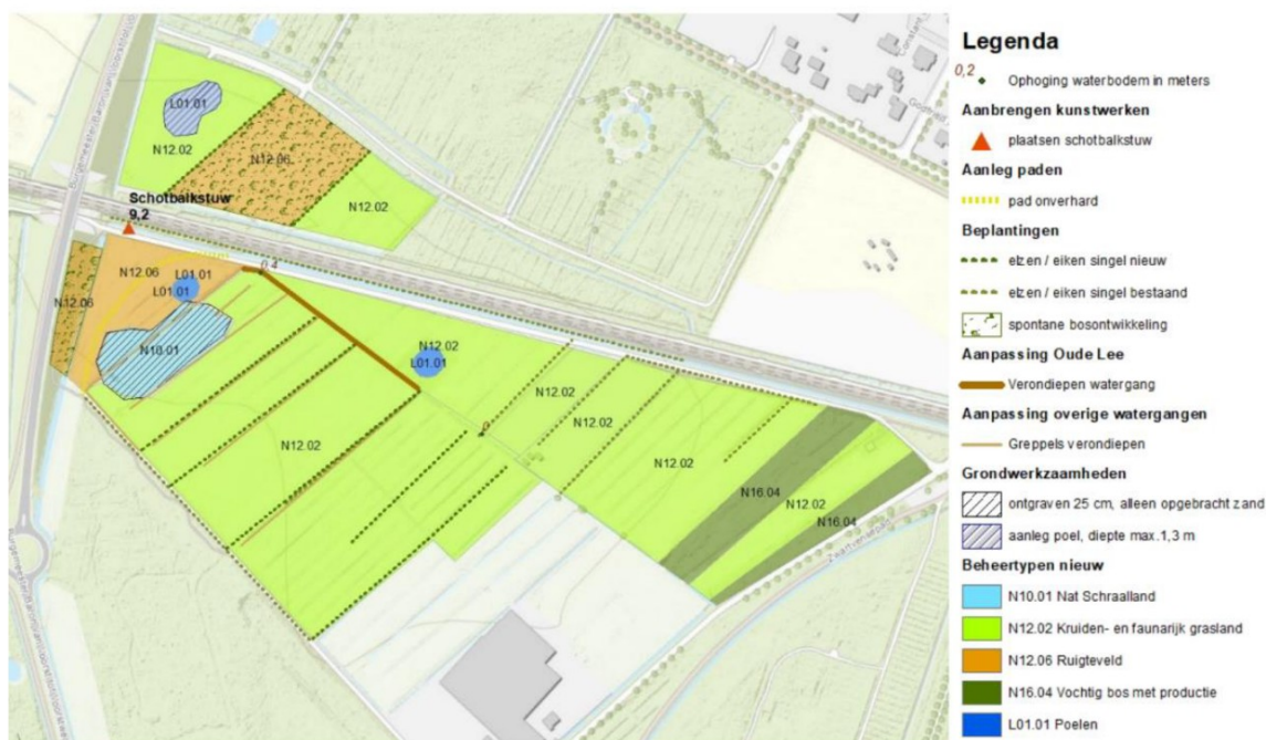
Figuur 3: inrichting van het oostelijke deelgebied.

Ter plaatse van 2 deelgebieden worden verlagingen gecreëerd. Tevens worden 2 (kleine) poelen aangelegd. De aanwezige greppels worden verondiept.