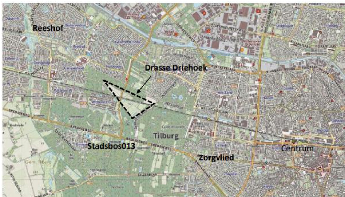
Figuur 1: ligging van de Drasse Driehoek

Het gebied wordt van zuid naar noord doorsneden door de Burgemeester Baron van Voorst tot Voorstweg en van oost naar west door de spoorlijn Breda-Tilburg (zie Figuur 2). Het is een cultuurhistorisch en natuurtechnisch waardevol kleinschalig open agrarisch gebied dat als een enclave in het bos ligt.