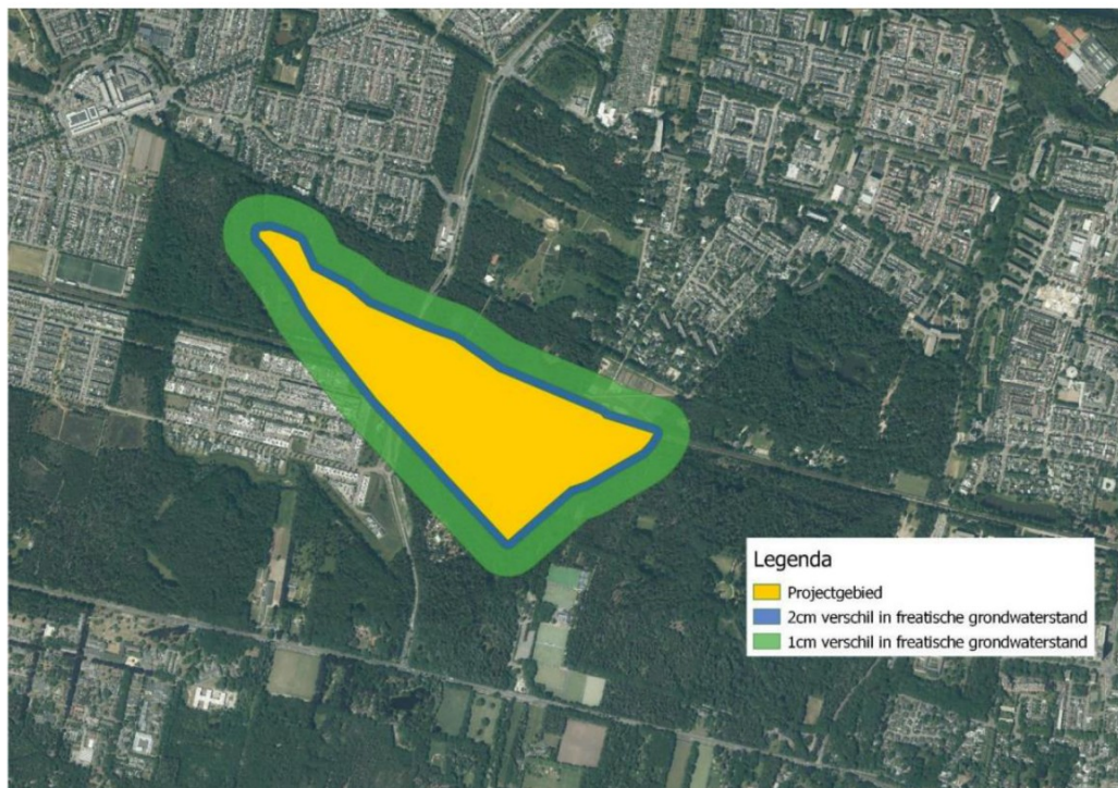
Figuur 5: Weergave van het verschil in freatische waterstand in de omgeving van de Drasse Driehoek

plasvorming op maaiveld en wateroverlast iets toenemen. De huidige plasvorming die gemiddeld 7 dagen per jaar zal optreden stijgt naar ruim 10 dagen per jaar. Gedurende droge perioden zal het grondwater als gevolg van een peilstijging van 10 cm ongeveer 7 cm minder ver uitzakken.