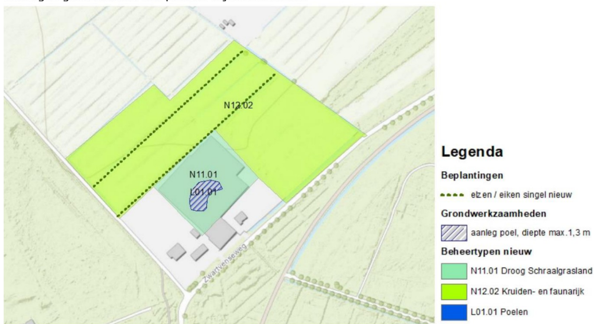
Figuur 4: inrichting van het meest zuidoostelijk gelegen deelgebied.

Ter plaatse van het meest zuidoostelijk gelegen deelgebied, langs de Zwartvenseweg, wordt het bestaande tuinbouwbedrijf verwijderd waardoor ruimte ontstaat voor een natuurlijke inrichting. De bestaande woningen grenzend aan het perceel blijven behouden