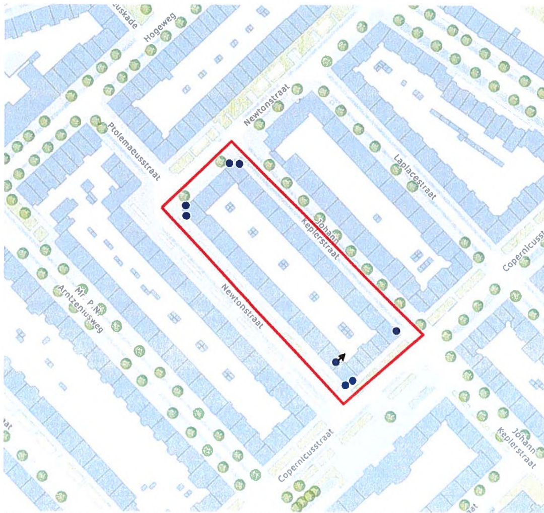
Figuur 1: Weergave van het plangebied met de locaties van de permanente compensatie in de vorm van acht inbouwkasten (blauwe stippen).