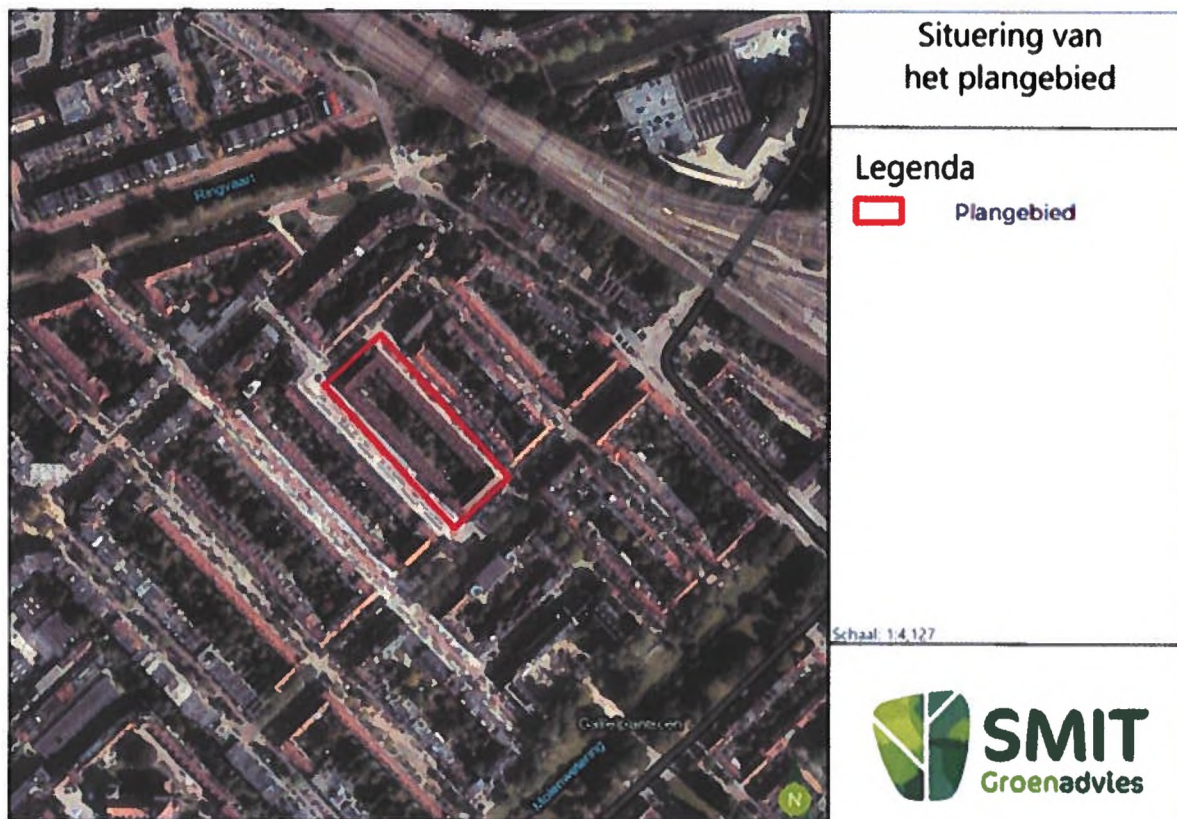
Figuur 1: Situering van het plangebied (rood omkaderd).