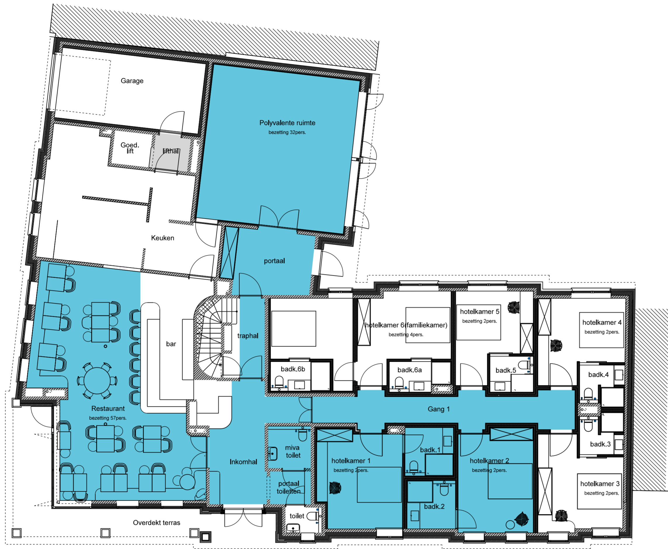
PLAN BEGANE GROND

opdrachtgever KO_INVEST project Ontwikkeling Markt 2 Retranchement: Bouwen van hotelfunctie onderwerp bouwvoorbereidingstekening overzicht toegankelijkheidssector