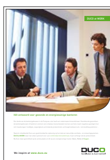
DUCO at WORK