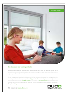
DUCO at HOME

Ontdek onze concepten in deze brochures: