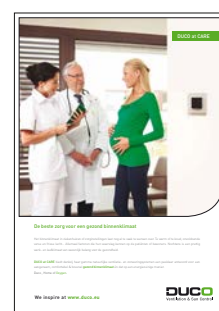
DUCO at CARE

bel +32 58 33 00 33 of mail naar info@duco.eu