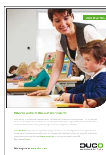
DUCO at SCHOOL