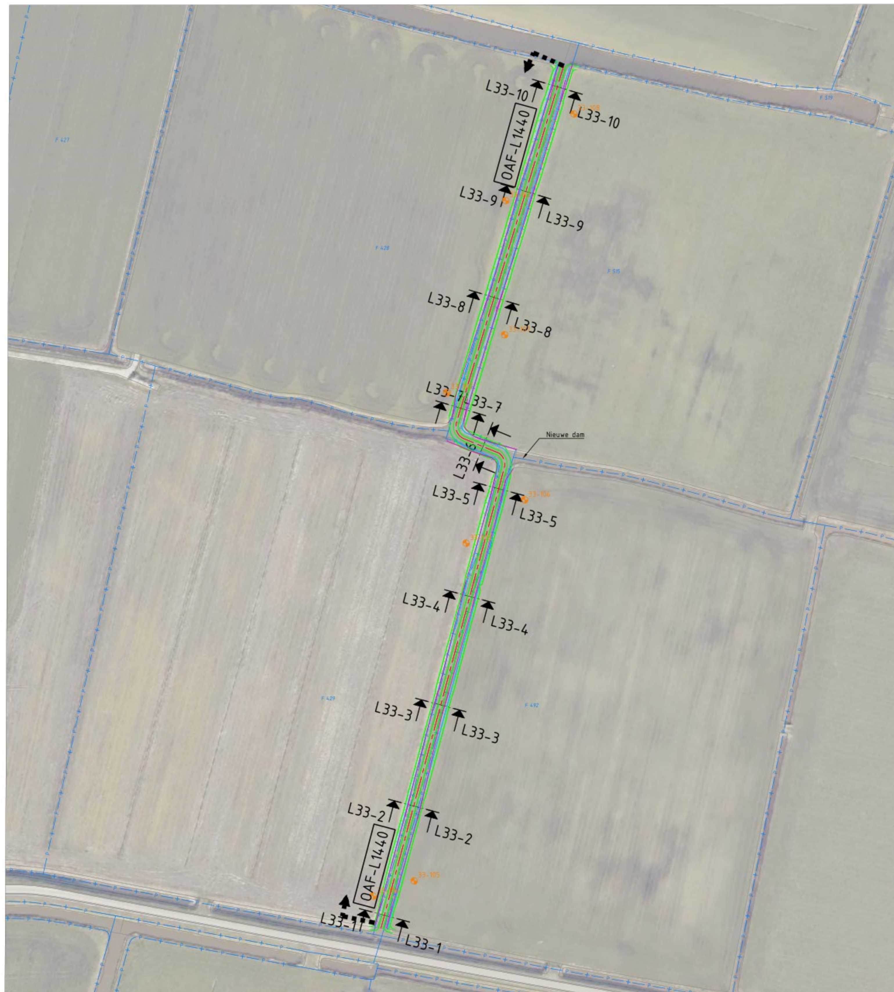
Overzicht Locatie 33 SCHAAL 1 : 1000