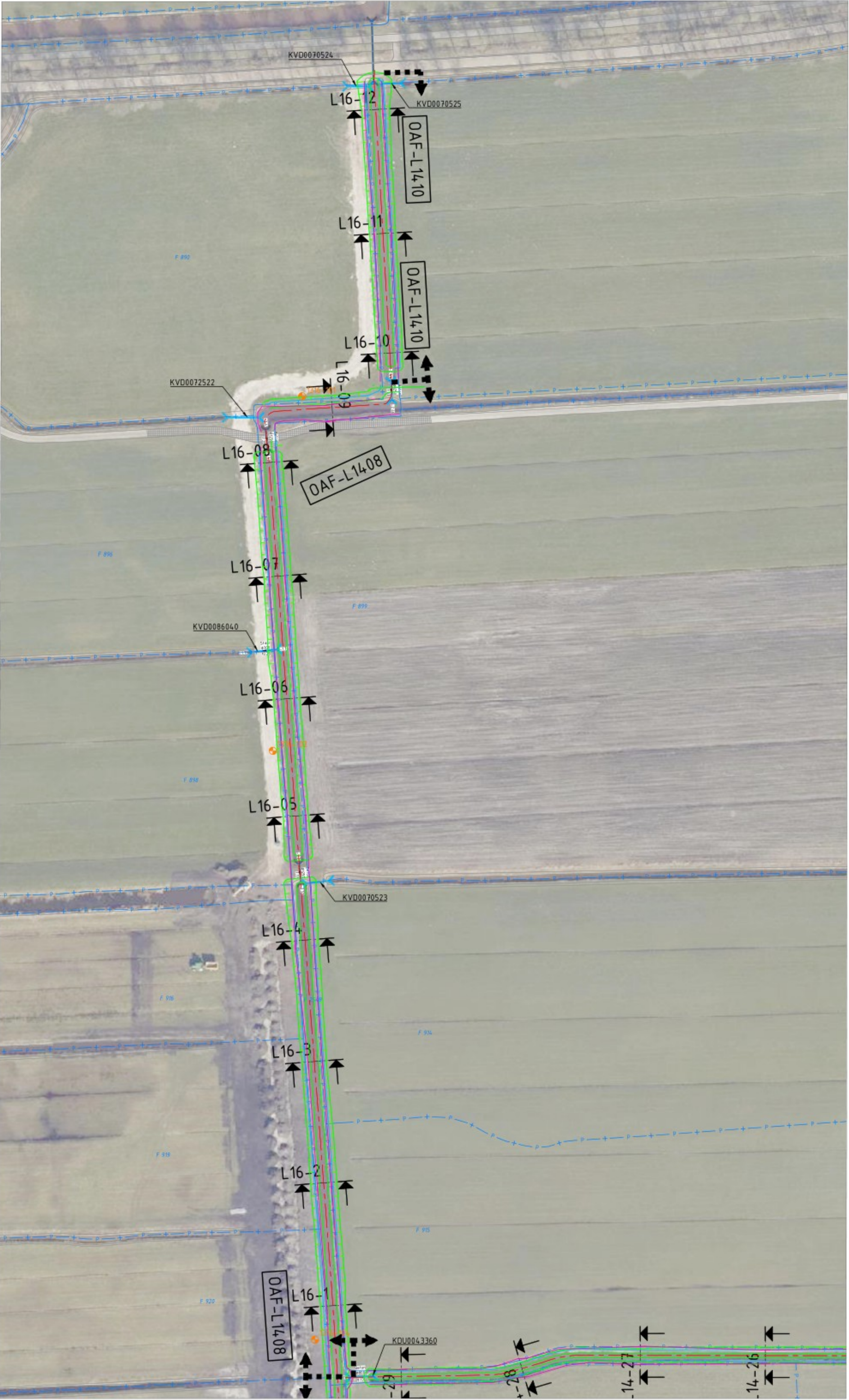
Overzicht Locatie 16 SCHAAL 1 : 1000