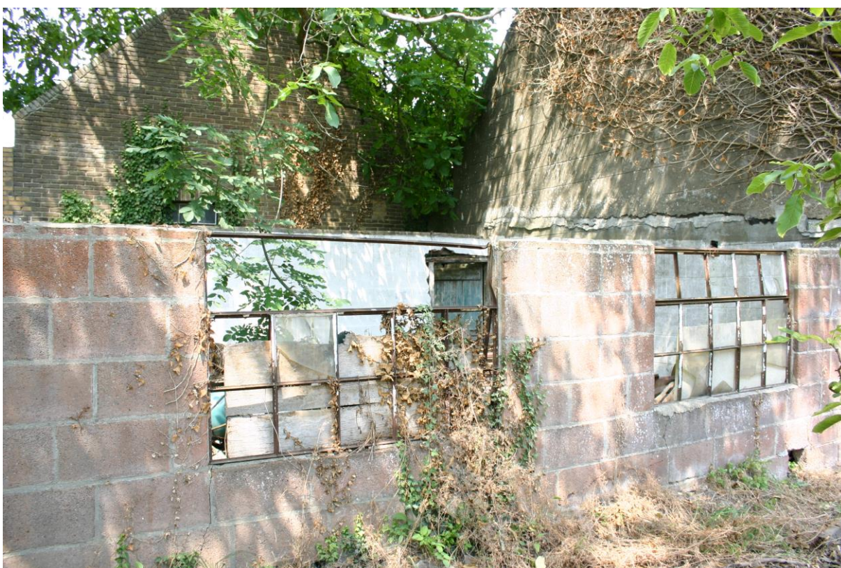
Figuur 5. Aan het uiteinde van de linkerzijgevel staat een te slopen opstal (meest zuidelijk in figuur 2).