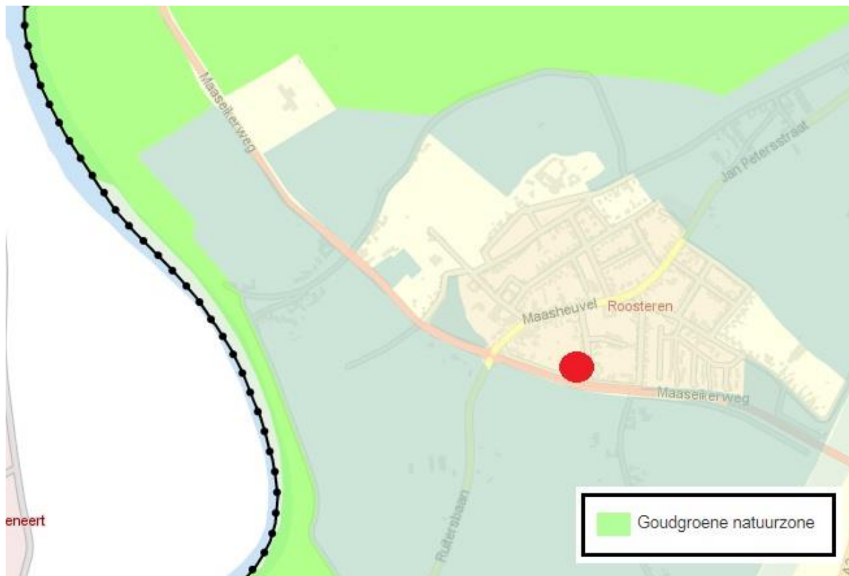
Figuur 10. Ligging van het plangebied (rode stip) ten opzichte van het LNN.

Het dichtstbijzijnde onderdeel van het Limburgs Natuurnetwerk (LNN), de goudgroene zone, ligt op 745 meter afstand ten westen van het plangebied (zie figuur 10).