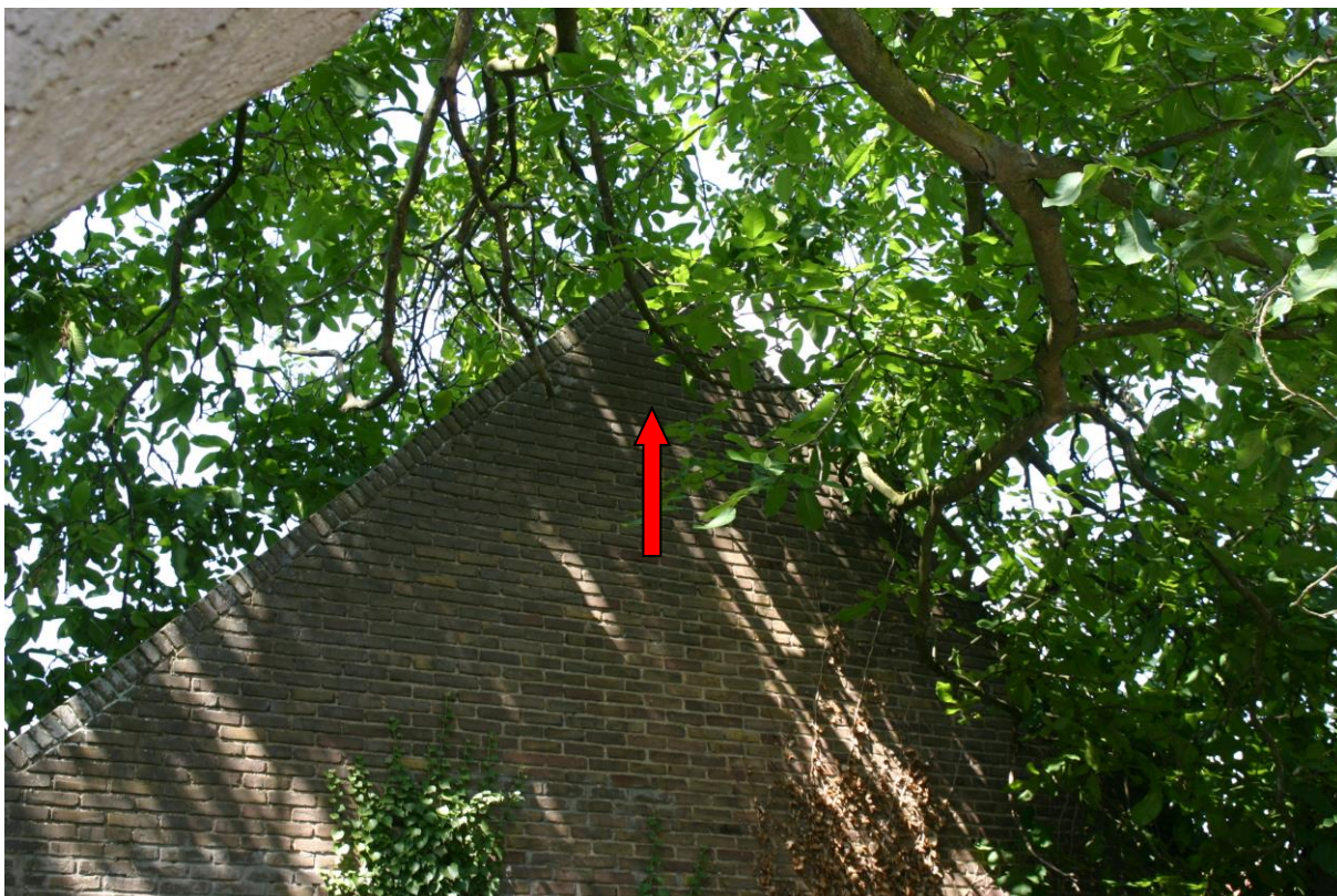
Figuur 14. Locatie (zuidelijke kopgevel in het zuidwesten van het plangebied) voor de te realiseren vervangende, permanente roestplaats van de kerkuil.