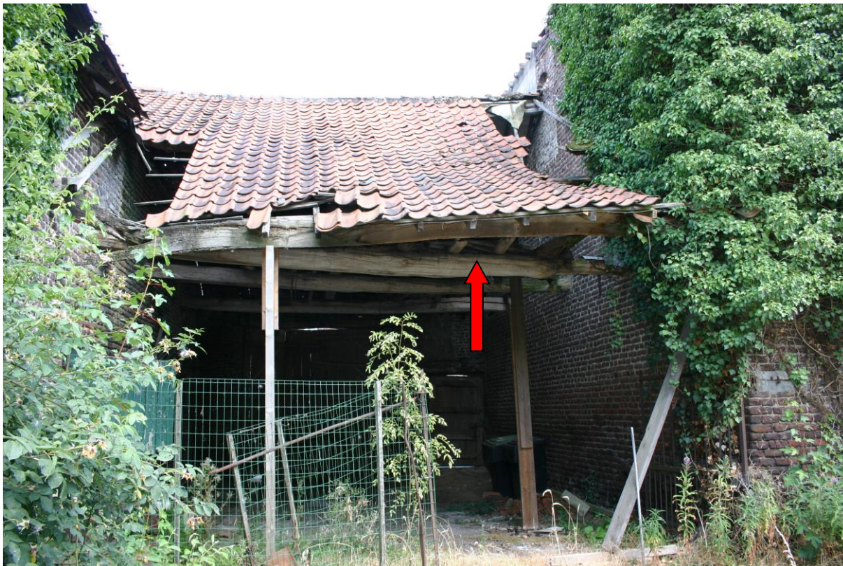
Figuur 11. Dak van de entree met daaronder een roestplaats van de kerkuil (rode pijl).

Jaarrond beschermde vogelnesten zijn in het plangebied afwezig. Het is echter wel te verwachten dat in het opgaand groen van het plangebied algemeen voorkomende vogels als koolmees (gaan) broeden. Volgens de natuurgegevens van de Provincie Limburg ( http://www.natuurgegevensprovincielimburg.nl ) kwam er in 2008 in het kilometerhok van het plangebied (het plangebied valt in twee kilometerhokken) een broedterritorium voor van de steenuil. Uit het veldbezoek blijkt dat nesten van deze soort zeker niet in het plangebied, of binnen een straal van 100 meter daaromheen, voorkomen. Het plangebied zelf is volgens de natuurgegevens van de Provincie Limburg onvolledig onderzocht.