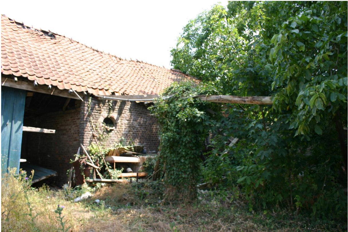
Figuur 6. De achterzijde van de carréboerderij betreft een varkensstal waarvan het dak gedeeltelijk is ingevallen. Rechts zijn de restanten (verticale houten balk) van een overkapping te zien.