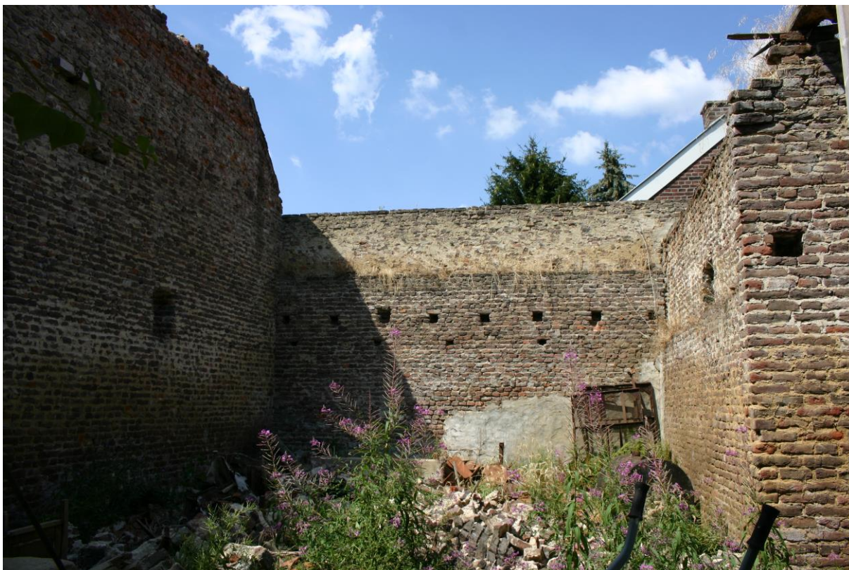
Figuur 8. Een gedeelte van de carréboerderij waar het dak ontbreekt (rechterzijgevel, foto genomen vanuit de binnentuin; zie ook noordzijde van het plangebied in figuur 3).