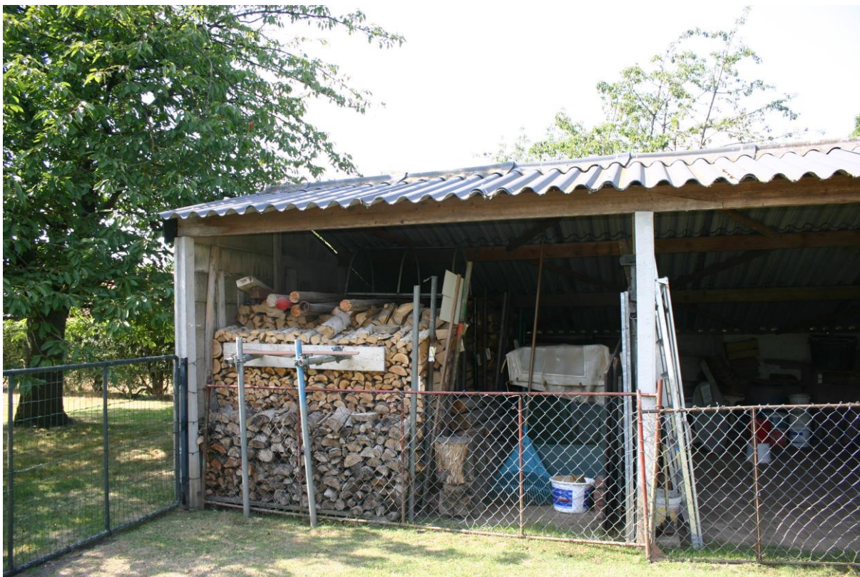
Figuur 12. Schuur van de buurman op nummer 20 waarin een kerkuilenkast mag worden opgehangen als tijdelijke mitigatie voor de kerkuil.