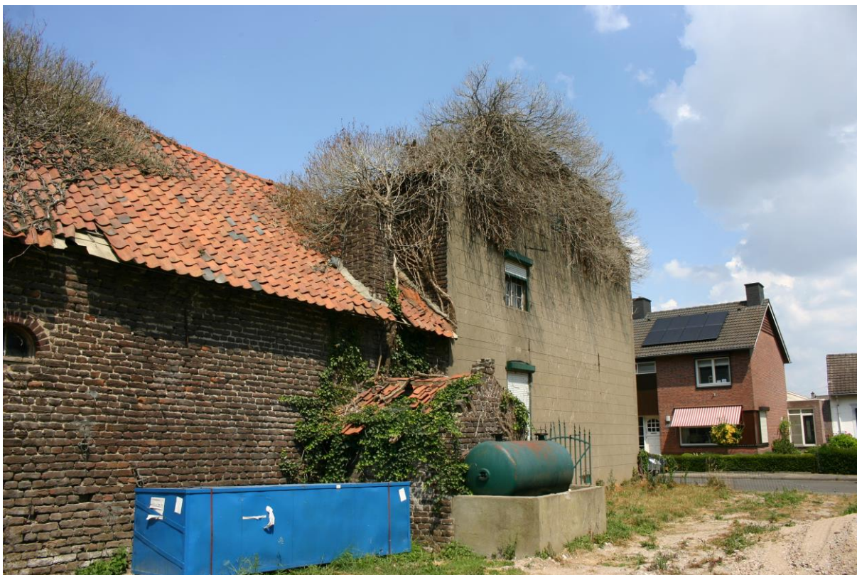
Figuur 4. Linker zijgevel van de carréboerderij. Het bakhuisje is overwoekerd en op het dak van de boerderij ontbreken meerdere dakpannen. Op het woonhuis ontbreekt het complete dak.