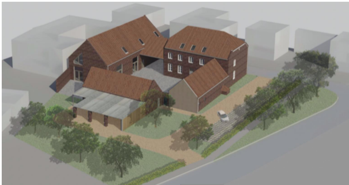
Figuur 2. Tekening van de voorgestane situatie.

De carréboerderij wordt geheel in zijn oude staat gerenoveerd. Hiertoe worden de dakconstructies vernieuwd (en toegevoegd waar deze ontbreken), ramen en deuren vervangen en vinden er in pandige renovaties plaats. De originele bouw en indeling van de boerderij blijven behouden. Daarnaast worden twee van latere datum daterende opstallen gesloopt (zie figuur 2). Dit betreft een schapenstal (noordelijk gelegen) en een opslaggebouw (zuidelijk gelegen). De bomen in het plangebied zullen blijven behouden.