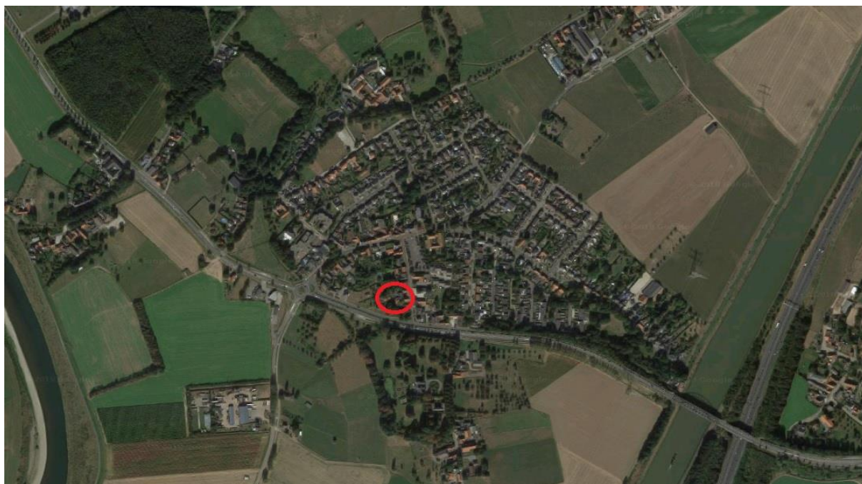
Figuur 1. Ligging van het plangebied.

5.1.2e is voornemens een carréboerderij aan 5.1.2e te Roosteren te renoveren. Hiervoor worden enkele delen van de bebouwing gesloopt en enkele delen gerenoveerd. Zie figuur 1 voor de ligging van het plangebied.