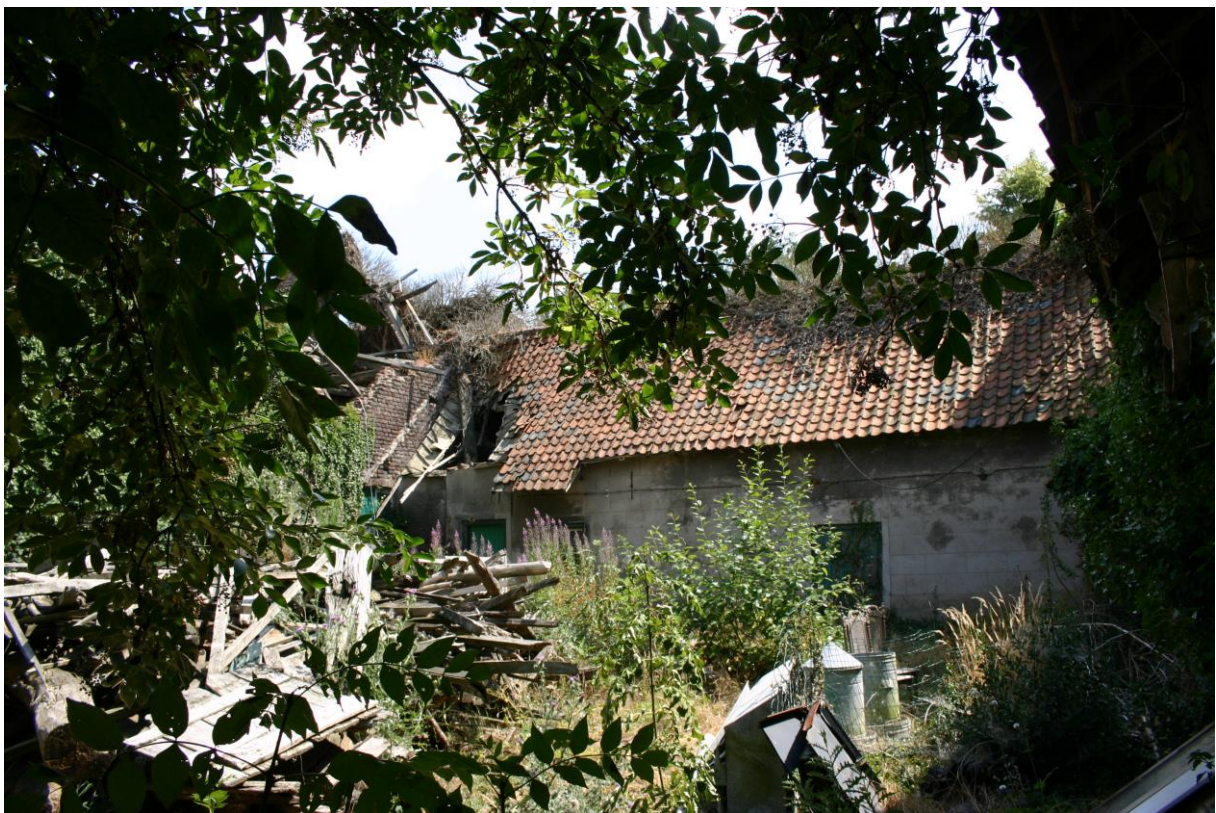
Figuur 7. De binnentuin van de carréboerderij is grotendeels overwoekerd (zie ook foto linksboven voorzijde rapport). De daken zijn op meerdere plaatsen ingevallen en ontbreken op enkele plekken helemaal (zie figuur 8).