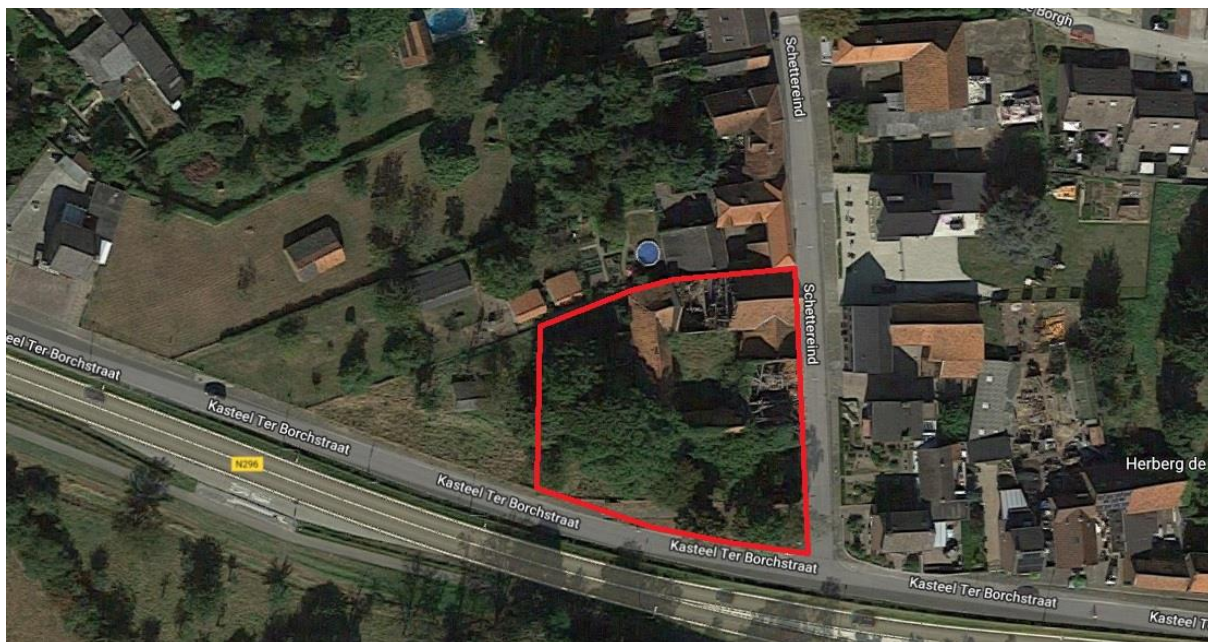
Figuur 3. Het plangebied.

Het plangebied ligt in het zuiden van de bebouwde kom van Roosteren (zie figuur 1). Ten noorden, oosten en westen van het plangebied liggen woningen met achtertuinen. Ten zuiden van het plangebied ligt de weg 5.1.2e met direct daarnaast de weg N296 (zie figuur 3). Achter deze wegen liggen voornamelijk weilanden.