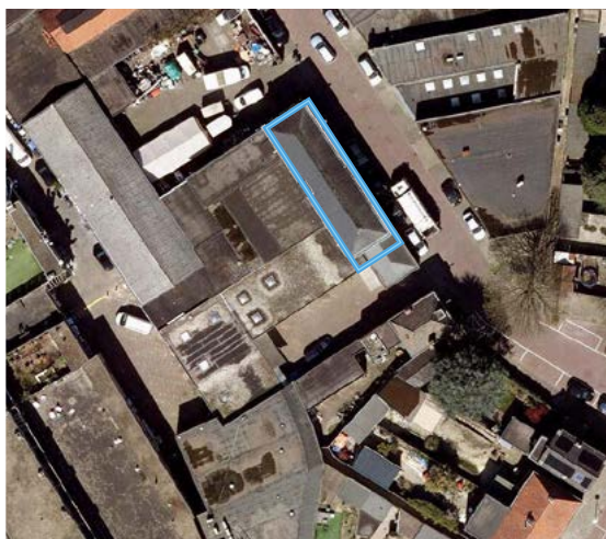
Visserstraat 16B-18 betreft blauwe contour