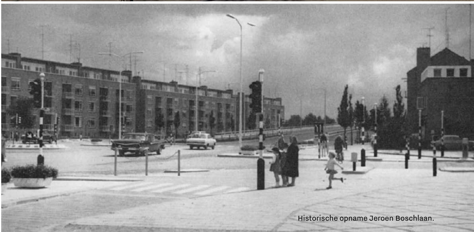
Historische opname Jeroen Boschlaan.