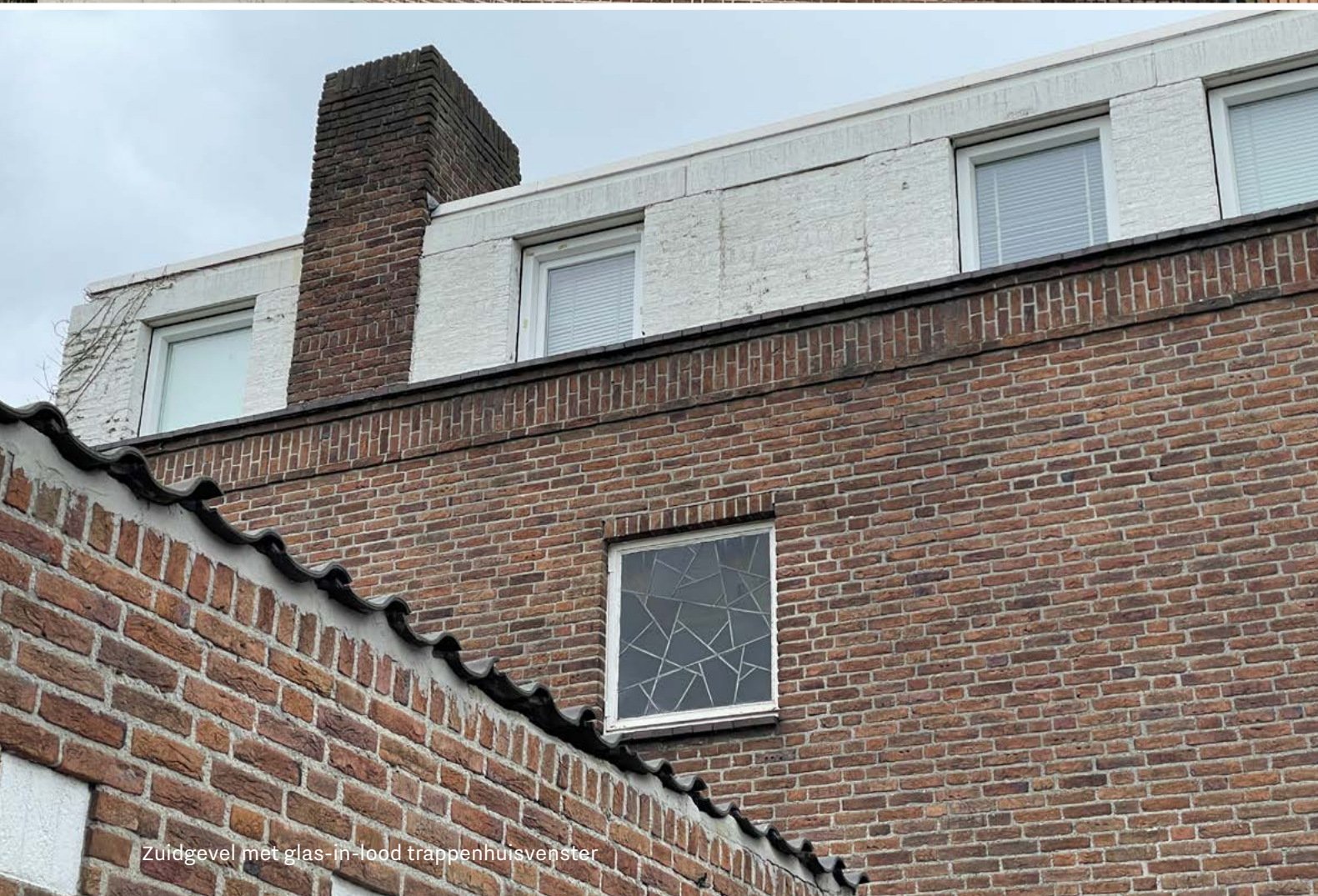
Zuidgevel met glas-in-lood trappenhuisvenster