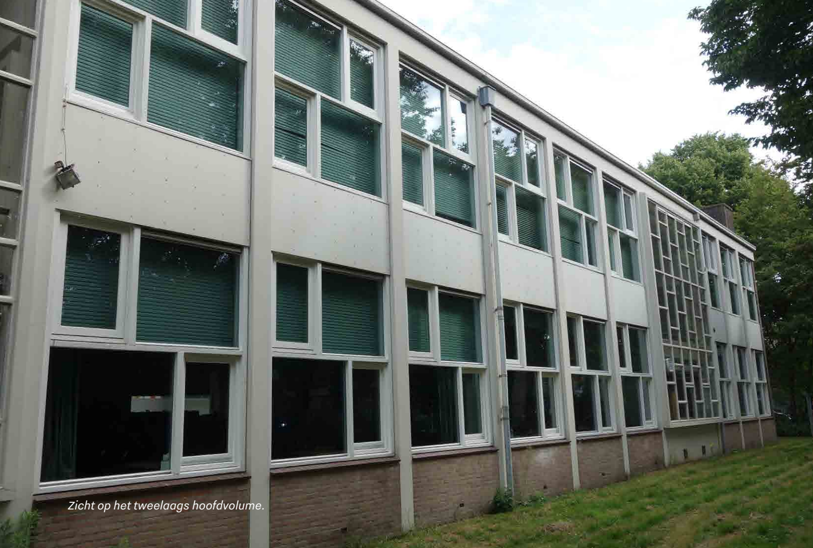
Zicht op het tweelaags hoofdvolume.