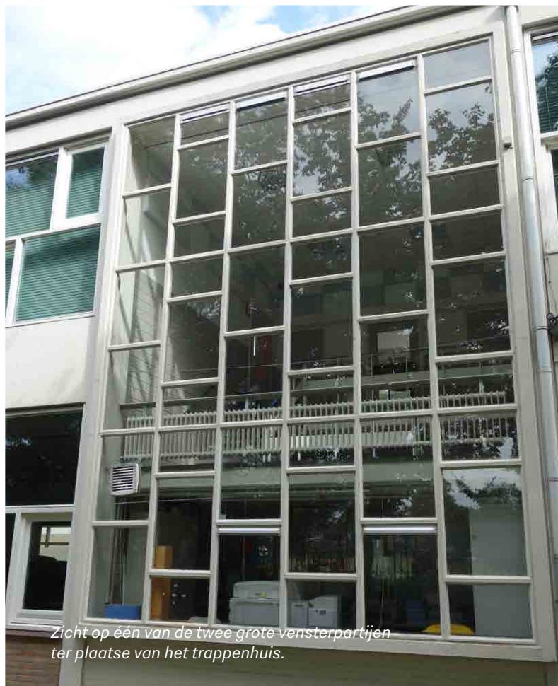
Zicht op één van de twee grote vensterpartijen ter plaatse van het trappenhuis.