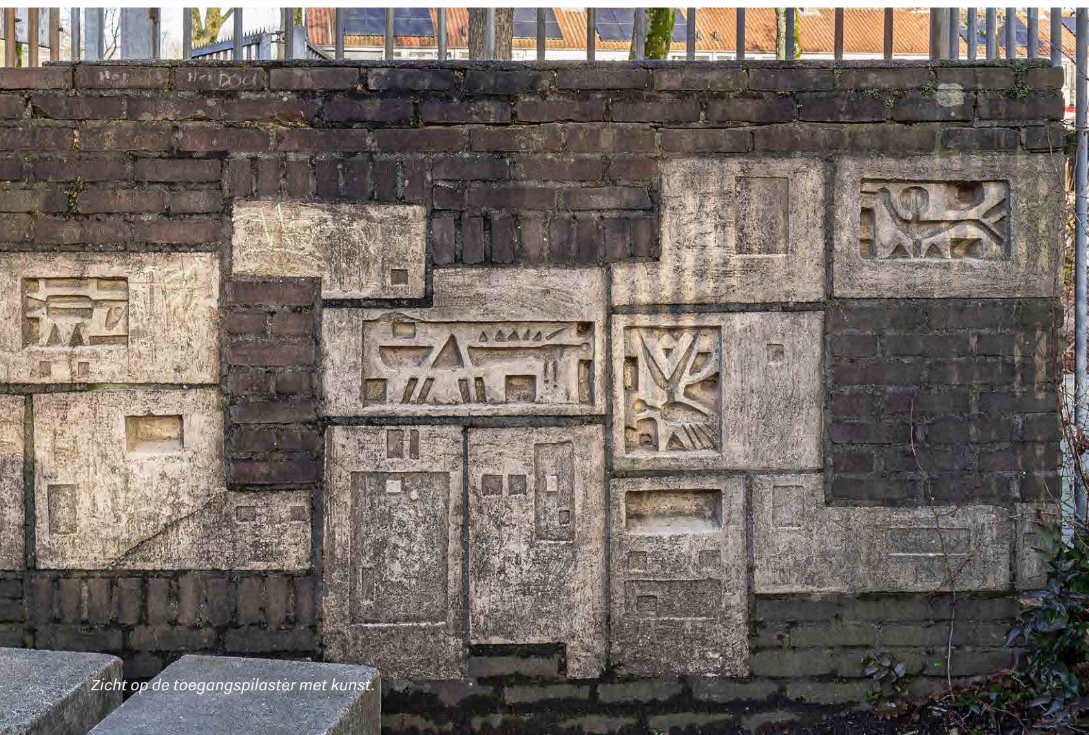
Zicht op de toegangspilaster met kunst.