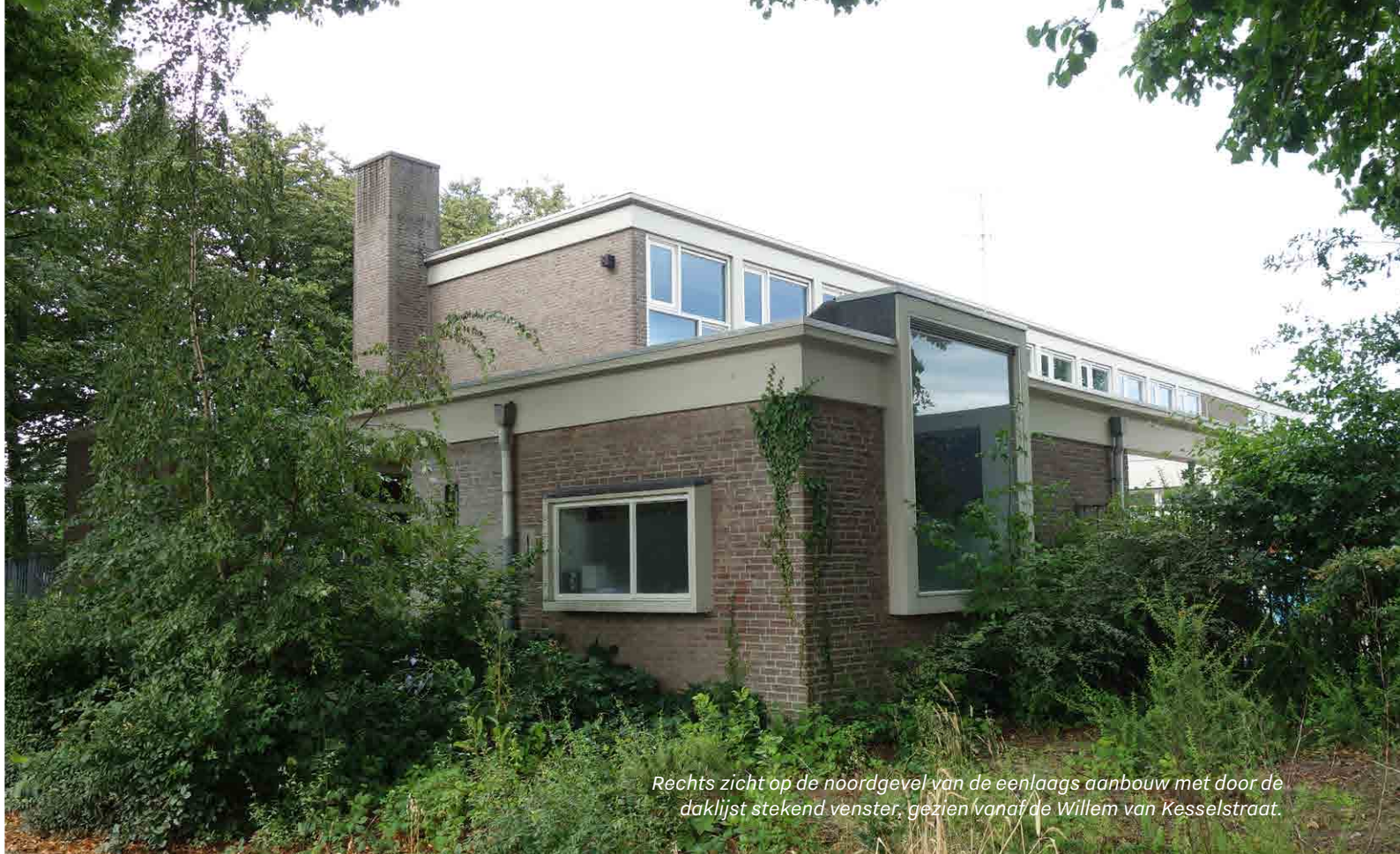
Rechts zicht op de noordgevel van de eenlaags aanbouw met door de daklijst stekend venster, gezien vanaf de Willem van Kesselstraat.