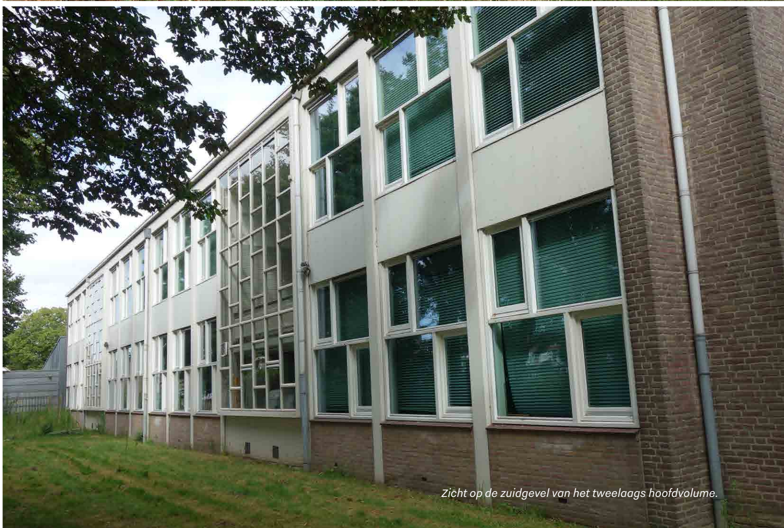
Zicht op de zuidgevel van het tweelaags hoofdvolume.