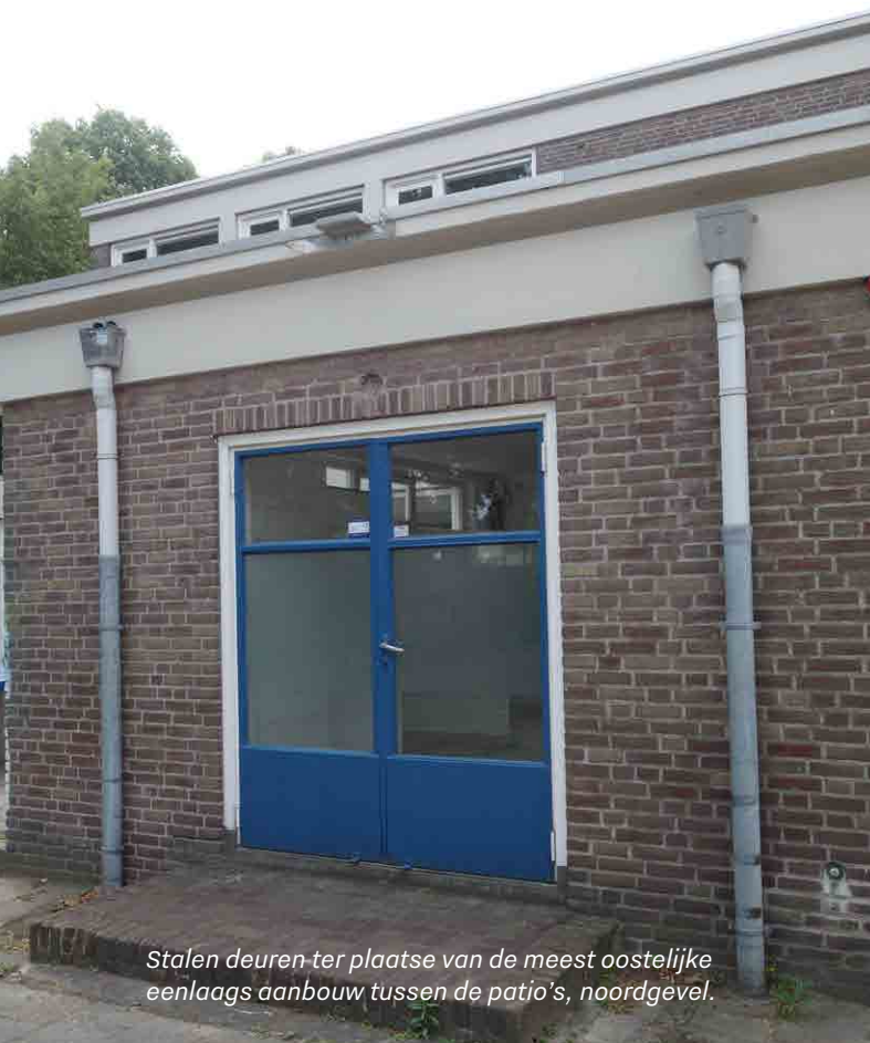
Stalen deuren ter plaatse van de meest oostelijke eenlaags aanbouw tussen de patio's, noordgevel.