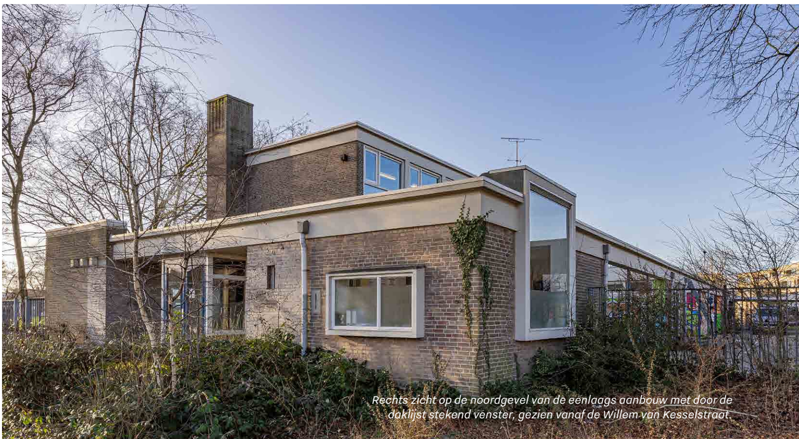
Rechts zicht op de noordgevel van de éénlaags aanbouw met door de daklijst stekend venster, gezien vanaf de Willem van Kesselstraat.